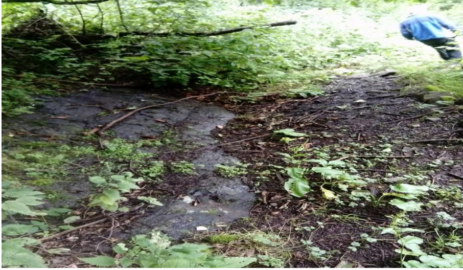
Fotoğraf 5. Halvanoto (Kaleiçi Otladı) ve B y ktepe arasındaki İpek yolu