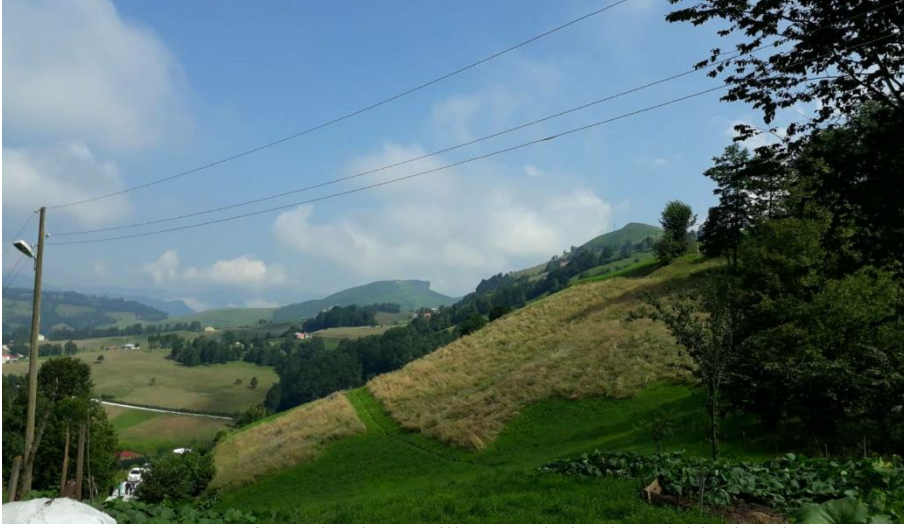
Fotoğraf 15. Toyfa merkezden Seslikaya'ya bakış (karşıdaki çıkıntılı yer)