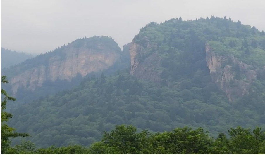
Fotoğraf 18. Baykuş Tepesi (İpek yolu dağın dibinden geçmektedir. Fotoğraf da karşısında yer alan Horoz Dağı'ndan çekilmiştir.)