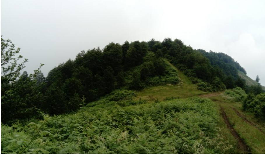
Fotoğraf 8. Büyüktepe ve üçgen taşların üzerinde at resminin bulunduğu gözetleme yeri