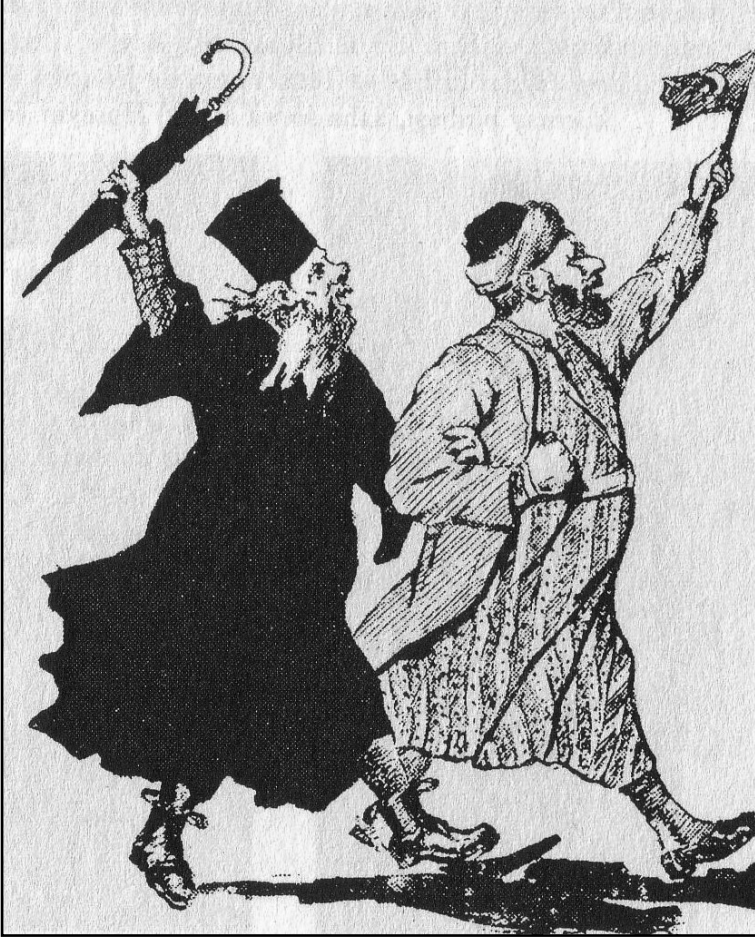
Çeşitli vesilelerle bir araya gelen hoca ve papazların bu durumunun karikatürize edilmiş hâli.

Bülent Tanör ve diğer bazı araştırmacıların vurgusuyla İttihat ve Terakki'nin Türkçülük politikaları ön plana çıkarılsa da, dönemin baş aktörlerinden Cemal Paşa, Hatırat'ında bu iddiayı şiddetle reddetmektedir (Cemal Paşa, 1996:350-351). Bununla birlikte, dönem; olayların merkezinde yaşamış bir aydının tespitiyle, gayrimüslim unsurların her birisinin daha çok, " hariçten gelen tahriklerle " kendi namlarına hak ve varlık iddia etmeye başladıkları bir dönemdir (Yalman, 1970:86).