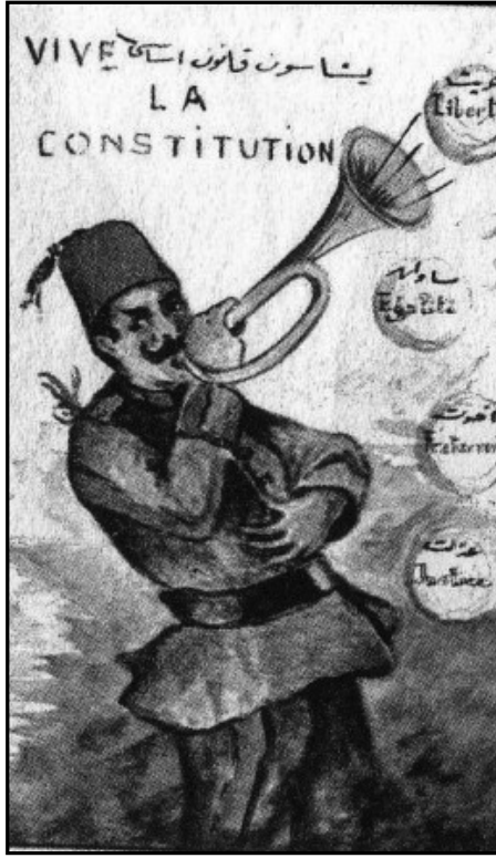
Meşrutiyetin ilanı Yaşasın Kanun-u Esasi Hürriyet Uhuvvet Musavat (Kaynak: Gülsoy, 2000)

işliyorlardı. Konuyu teyit bağlamında, döneme ait eserlerde çok açık beyanlara rastlamak mümkündür (Aydoğan ve Eyüboğlu, 2004:144-147; Talat Paşa, 2003:49-56).