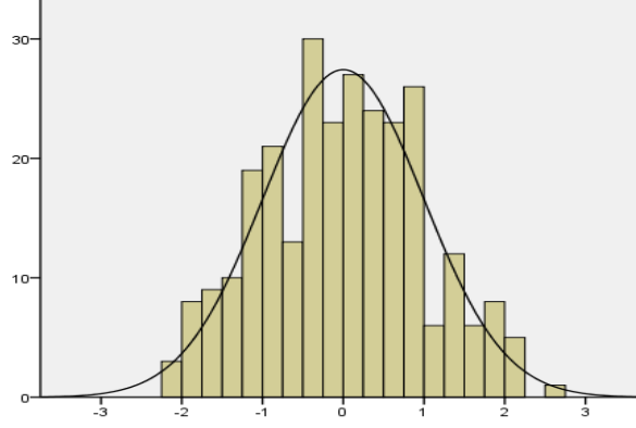
Şekil 1. Standardize edilen SYOT puanları histogram grafiği

Öğretmen adaylarının Suriyelilere yönelik olumsuz tutumlarının çokkültürlülük algısı ve diğer kâmlık değişkeni tarafından yordanıp yordanmadığını belirlemek için çoklu doğrusal regresyon analizi yapılmıştır. Öncelikle çoklu regresyon analizinin varsayımları sınanmıştır. Verilerin normallik varsayımının sınanmasına yönelik olarak histogram grafiği (Şekil 1) ve doğrusallık varsayımının incelenmesine yönelik oluşturulan saçılma diyagramı (Şekil 2) aşağıda verilmiştir.