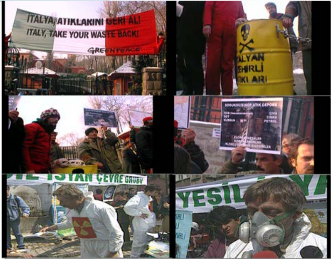
Resim 8: Çevre ve Kültürel Miras Adlı Belgeselden Görseller

Yetimova, S. (2019). Dünya Medyasında (Belgesel - Video Haber - Haber) Öne Çıkan Çevreci Protesto Örnekleri: Çevre Sorunlarına Karşı Verilen Tepkilere Dair Kültürel Bir İnceleme. Dördüncü Kuvvet . 2 (2). 40-74.