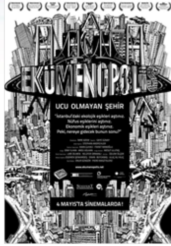
Resim 2. Ekümenopolis Belgeselinin Afışı

Yetimova, S. (2019). Dünya Medyasında (Belgesel - Video Haber - Haber) Öne Çıkan Çevreci Protesto Örnekleri: Çevre Sorunlarına Karşı Verilen Tepkilere Dair Kültürel Bir İnceleme. Dördüncü Kuvvet . 2 (2). 40-74.