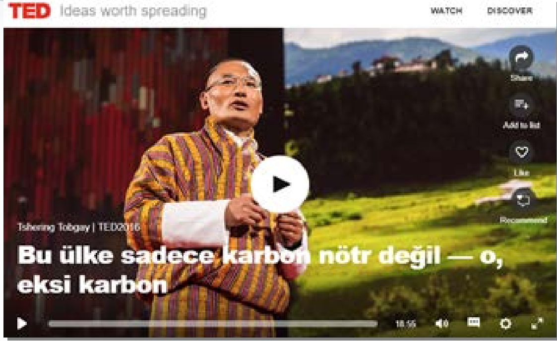
Resim 7: Tshering Tobgay'ın 2016 yılında yaptığı TEDX Konuşması

Yetimova, S. (2019). Dünya Medyasında (Belgesel - Video Haber - Haber) Öne Çıkan Çevreci Protesto Örnekleri: Çevre Sorunlarına Karşı Verilen Tepkilere Dair Kültürel Bir İnceleme. Dördüncü Kuvvet . 2 (2). 40-74.