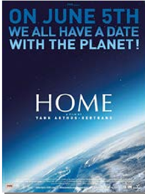
Resim 1. Yuva Belgeselinin Afişi

Çevre sorunlarına eğilen en önemli çalışmalardan bir Yuva 12 (Home, 2009) belgeselidir. Çekimleri 3 yıl sürmüş olan belgesel, 54 ülkede, havadan çekilen görüntülerle oluşturulmuş olup; yönetmenliğini Yann Arthus-Bertrand üstlenmiş dağıtımını ise ünlü Fransız yönetmen Luc Besson sağlamıştır. Belgeselin senaryo ve metnini Fransız gazeteci Isabelle Delannoy kaleme almıştır. Belgesel, 5 Haziran 2009 tarihinde Dünya Çevre Günü münasebetiyle dünya ile eş zamanlı olarak NTV'de gösterime girmiştir. Belgesel belirtilen günde ücretsiz olarak sinemalar, televizyon kanalları, DVD formatı ve internet üzerinden de yayına girmiştir (NTV Haber, 2009).