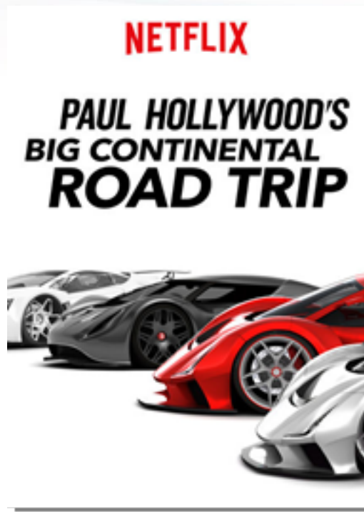
Resim 5. Paul Hollywood'un Avrupa Seyahati Adlı Belgeselin Afışı

Bir Greenpeace hikâyesi olan Dünyayı Nasıl Değiştiririz? belgeseli de aynı şekilde Netflix içerikleri arasında ön plana çıkmaktadır. Jerry Rothwell'in yönetmenliği yaptığı belgesel, çoğunlukla arşiv görüntülerini kullanarak Greenpeace çevre örgütünün kurulduğu 1970'ler dünyasına ve o dönemdeki toplumsal muhalefete odaklanmaktadır. Özellikle Amerika, Kanada ve Sovyetler Birliği'ndeki çevreye zararlı uygulamalarla nasıl mücadele edildiğini anlatan belgeseli özgün kılan noktalar bir döneme damga vurmuş Greenpeace üyeleri ile röportajlar yapması ve dönemin tarihsel portresini hem psikolojik hem de sosyolojik çehresiyle birlikte vermesidir. Belgesele göre çevreci hareketin etkin olmasındaki temel neden özellikle Batıda sivilleşme hareketlerinde kendini göstermiştir. 1960'lar Fransa'sından dünyaya yayılan özgürlükçü gençlik hareketleri çevre sorunları dâhil tüm bireysel, toplumsal ve yönetsel alanlarda etkisini göstermiştir. Özellikle "kadın hakları savunucularının, asker kaçaklarının, ağaç severlerin, anarşistlerin, radikal öğrencilerin, özgürlük savaşçıların, çöp dökme karşıtlarının, kafayı bulmuşların, vejetaryenlerin, Budistlerin, balık koruyucularının, doğal hayata dönenlerin"