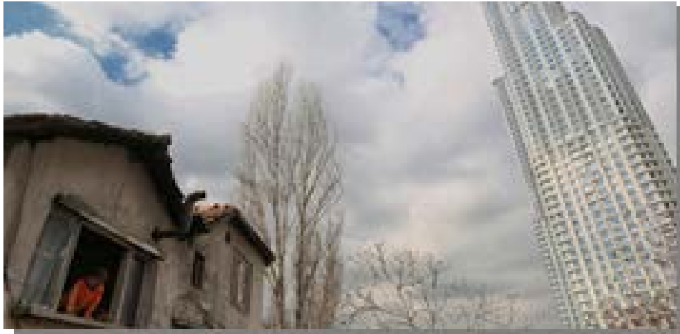
Resim 3. Ekümenopolis Belgeselinin Afışı