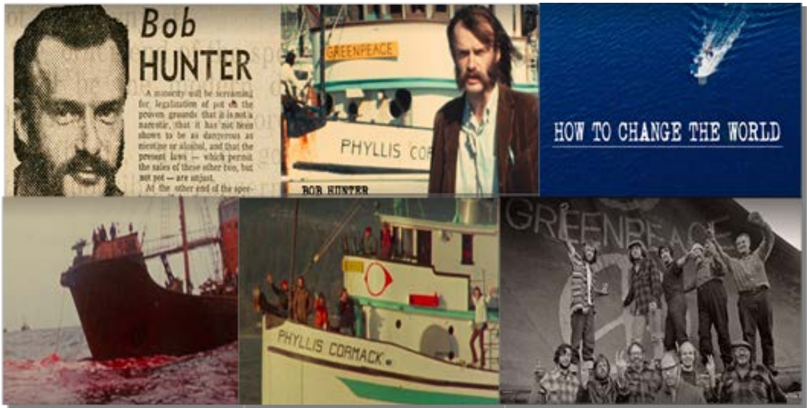
Resim 6. Dünyayı Nasıl Değiştiririz Belgeselinden Görseller

Bu kategoride dikkatle incelenmesi gereken video çalışmalarından biri ise Bhutan başbakanı olmuş Tshering Tobgay'ın 2016 yılında yaptığı TEDX 21 konuşmasıdır. Konuşmasının başında