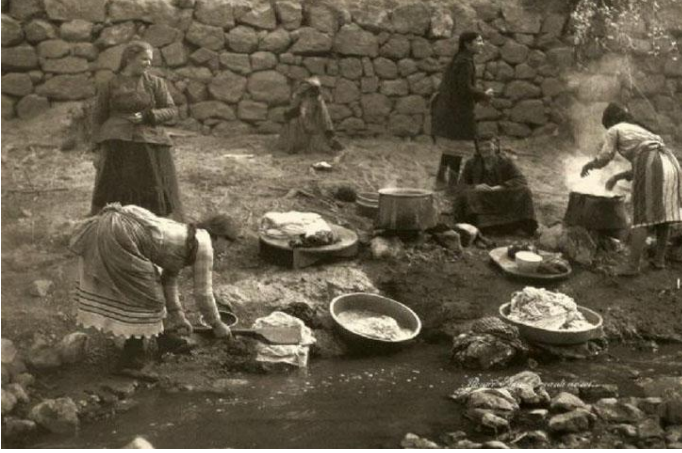
Şekil 2: Zir Vadisi Kenarında Hep Birlikte Çamaşır Yıkayan Kadınlar, 1929 2

Çamaşırhaneler genelde dört köşeli üstü açık binalardır. İçlerinde çamaşır suyunun ısıtıldığı ocakların bulunduğu bölüm, çamaşır yıkanan taş, çamaşır durulanan kısım ve bazı çamaşırhanelerde var olan banyo bölümü gibi bölümlerden oluşan basit yapılardır.