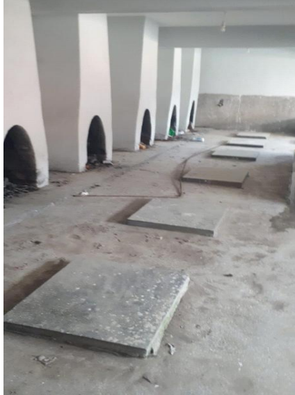
Şekil 6: Ilgaz Çamaşırhanesi Günümüzdeki Görünümü (İç Mekan)

Çankırı ili Ilgaz ilçesindeki su ile yapılan işler bu şekilde çözülmeye çalışılırken köylerde daha zorlu şartlarda ihtiyaçlar karşılanmıştır. Hacılar Köyü'nde kuyuda çamaşır yıkamış bir başka kişi olan 1952 doğumlu Münire