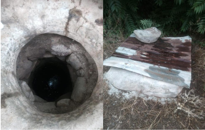
Şekil 7: Çankırı Hacılar Köyü’nde Bulunan Kuyu

Çankırı da su günlük ihtiyaçlar, genel geçer kurallar çerçevesinde şekillenmez sadece baki hayata kavuşulduğunda ya da bir ihtiyaçtan doğan dileme ve dileme ile ilgili ritüeller farklılık ve değişkenlik göstermekle birlikte geçmişten günümüze kadar yaşamını devam ettirmiştir.