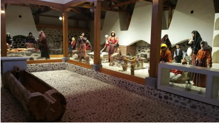
Şekil 4: Çankırı Çamaşırhanesi İç Mekan Görünüm

Çankırı Çamaşırhanesi II. Abdülhamit döneminde yapılmış, yapım türü yığma yapı tekniğinde, geçmişte sosyal ve kültürel faaliyetlerde de çok amaçlı olarak kullanılmıştır (Çetiner, 2011: 523). Çankırı Çamaşırhanesi Çankırı Kültür Envanteri'nde: "Cumhuriyet Mahallesi'nde halkın ortak çamaşır yıkama yeri olarak yapılmış bir çamaşırhanedir" şeklinde açıklanmaktadır. Çankırı Tatlısu Çamaşırhanesi, Çankırı Belediyesi tarafından restore edilmiş ve müze olarak hizmete sunulmuştur. Aslına uygun olarak restore edilmeye çalışılan çamaşırhanede yapıldığı dönemdeki ayrıntılar olduğu gibi korunmuş içerisinde kullanılan malzemeler ve mankenlerin üzerine giydirilen giysilerle o günkü çamaşırhane ortamı yaratılmaya çalışılmıştır.