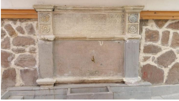
Şekil 5: Çankırı Tatlısu Çamaşırhanesi Çeşmesi

Çankırı Tatlısu Çamaşırhanesi dikdörtgen bir yapıdır. İçerisinde su ısıtılan kazanların bulunduğu ocaklar vardır. Çamaşırın yıkıldığı İldızım Köyü'nden getirildiği için bu isimle anılan yassı İldızım Taşı bulunmaktadır. Çankırı çamaşırhanesinde banyo bölümü yoktur. Üzeri açık olan çamaşırhanenin sadece çamaşır yıkanan bölümleri kapalıdır. 14 x 20 m. ölçülerinde dikdörtgen planlı olan yapının sokak cephesinde çeşme ve yazıt, iç kısmında ise, çeşme, ocaklar ve çamaşır yıkama sekileri bulunmaktadır. Çamaşır sekilerinin üzerini kaplayacak şekilde yapılan ve alaturka kiremitle örtülen çatı, avluya doğru eğimli olup, orta kısmının üzeri açık bırakılarak bir çeşit iç avlu oluşturulmuştur. Dış cephedeki çeşmenin üst seviyesine kadar moloz taş, üst kısımları ise ahşap çatkı arası kerpiç dolgu ve sıvalıdır. İçinde 4 büyük ocak ve 8 çamaşır taşı yer almaktadır (Çankırı Kültür Envanteri, 2014: 209). (Bkz. Ek 1).