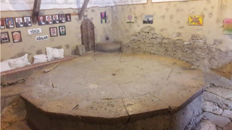
Şekil 3: Safranbolu Yörük Köyü 12 Köşeli Yunak Taşı

Çamaşırhaneler genelde dört köşeli üstü açık binalardır. İçlerinde çamaşır suyunun ısıtıldığı ocakların bulunduğu bölüm, çamaşır yıkanan taş, çamaşır durulanan kısım ve bazı çamaşırhanelerde var olan banyo bölümü gibi bölümlerden oluşan basit yapılardır.