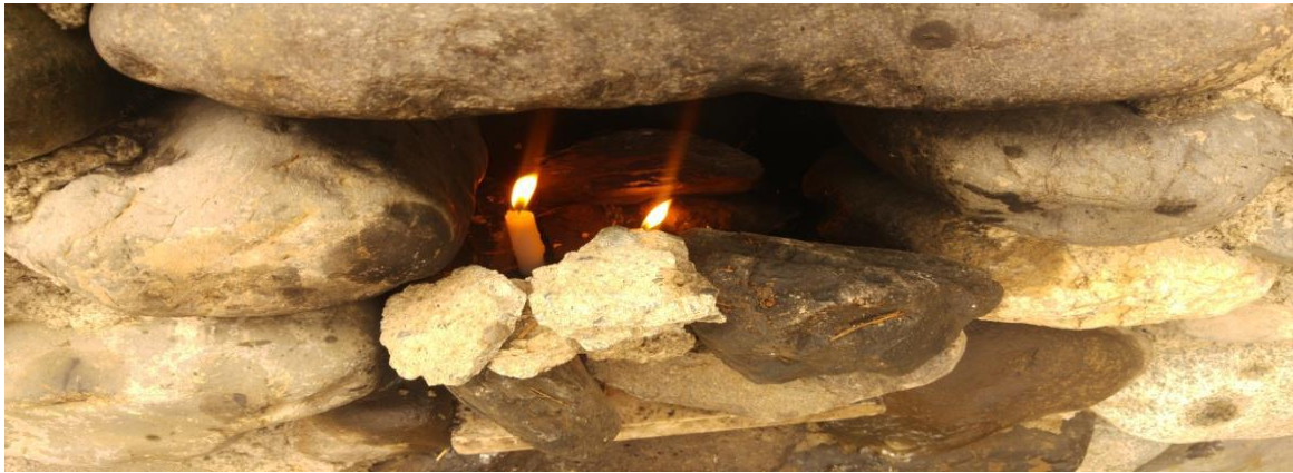
Görsel no.8. Erzincan iline bağlı Tercan ilçenin Yaylacık köyünde bulunan Doğan Dede Türbesi, mum adağı.