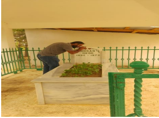
Görsel no.7. Tercan Yaylacık köyü Doğan Dede ziyareti

Ziyaret yerlerinde İslâmi geleneğin önemli bir etkisi vardır. Gözcü Baba adı verilen ancak hiçbir dini vasfı bulunmayan bir yapının Hz. Ali’nin orada bulunmuş olabileceği inancı ile dini bir ziyaret yeri haline getirilmiştir. Üstelik bu dini ziyaret yeri haline getirilen yapının içerisinde, çocuk resimleri, mum kalıntıları ve bez parçalarına (çaput) rastlanması, halk inanmaları adını kullanmayı tercih ettiğimiz İslâm öncesi uygulamaların<pratiklerin< meşrulaştırılarak İslâm dinindenmiş gibi gösterilmeye çalışıldığının göstergesidir