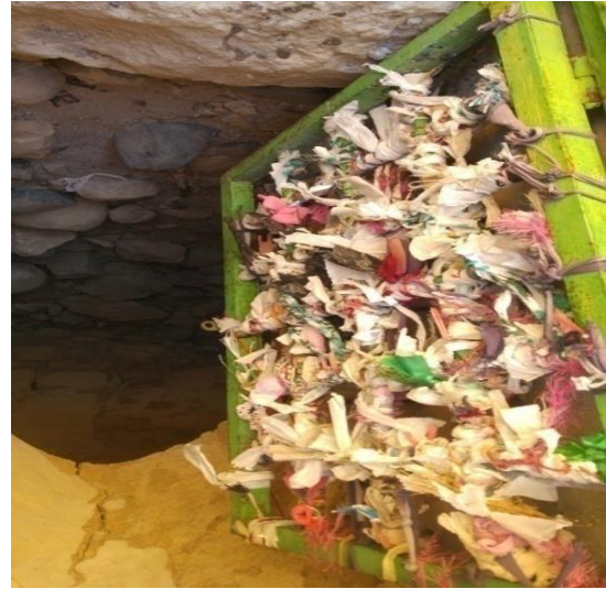
Görsel no. 5. Kemah ilçe merkezi Gözcü Baba Türbesi. Görsel no.6. Gözcü Baba türbe kapısı

Tüm bunların yanında türbe içerisinde, mum kalıntıları ve türbe duvarlarında farklı kişilere ait küçük çocuk resimlerine de rastlanılmıştır. Bu durumda bize, gözetleme kulesi olarak kullanılan yapının çeşitli dilek ve niyazlara hizmet ettiğini göstermektedir. “Şu tarihî gerçektir ki, dünyanın neresinde ve hangi devirde olursa olsun, halkın hayal gücü hiç bir