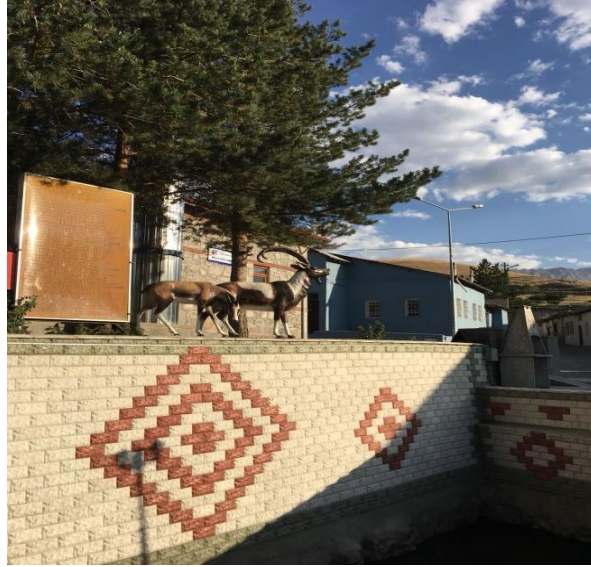
Görsel no.3. Merkeze bağlı Molla Köyü ve cami önünde ki dere.

halkı arasında para toplanır, kurban kesilir.Su, yöre halkı arasında “süt gözesi” olarak da bilinir. Sütü olmayan gelinlere bu sudan içirilir (K.K 8).