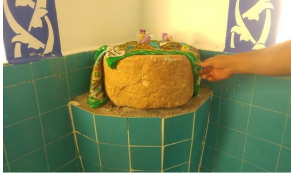
Görsel no.1. Şeyh Hasan El Kirzi Türbesi İçerisinde Bulunan Tövbe Taşı

Müslüman olmak isteyen gayri Müslimler bu taşa el sürerek şahadet getirip Müslüman olurlardı. Günümüzde bu taş çeşitli rahatsızlıklardan (sara ve ruh hastalıkları) kurtulmak için kullanılır. Uygulama taşa el sürülerek “Hastalığın bu taşta kalsın” diyerek yapılır. Her türlü mezhep unsurunca ziyaret edilen türbenin, belli bir ziyaret günü yoktur. Etrafında mum ve bez bağlama türünden pratiklerin bulunmadığı ziyaret yerinde genellikle küçükbaş hayvanlar adak olarak adanmaktadır. Kurban kesimi için türbenin hemen yanında bir yapı bulunmaktadır” (K.K 3).