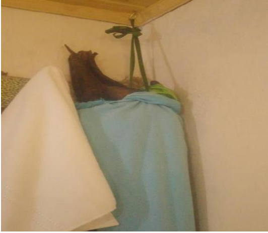
Görsel no.9. Erzincan merkezine bağlı Avcılar köyü Tarık Ziyareti.

Görsel 7,8 ve 9 da bulunan ziyaret yerleri, daha çok Alevî-Bektaşî vatandaşlar tarafından rağbet görmektedir. Doğan Dede adı verilen ziyaret yerine, her türlü dilek sahibi gelmek ile birlikte çoğunlukla çocuğu olmayan, konuşamayan, sara hastası olan ziyaretçiler gelmektedir. Ziyaretin ilk şartı kalpten inanmaktır. Bunu mezarın hece taşını öpme, üç İhlâs bir Fatıha okuma takip etmektedir. Daha sonra dilek sahibi kişi dileğinin kabul olması için ziyaretin dışında bulunan bel hizasındaki bir oyuğun içine mum yakmaktadır. Dileği kabul olan ziyaretçiler ziyaret yerine tekrar gelip kurban kesmektedir. Kurban kesimi, dağıtımı ve yemek pişirimi gibi ihtiyaçların karşılanması için ziyaret yerinde bir yapı dahi bulunmaktadır.