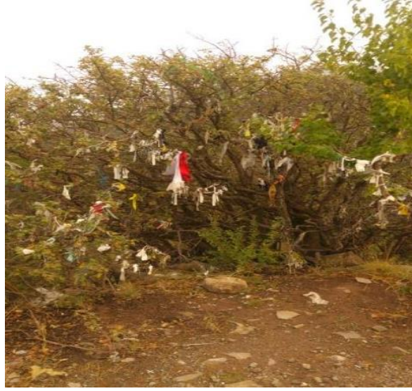
Görsel no.2. Binkoç köyü Acepşir Gazi türbesi yanında bulunan çalı.

Merkeze bağlı Binkoç köyünde oldukça yüksek bir tepede bulunan Acepşir Gazi türbesi Sünnî vatandaşlara yönelikbir türbe olsa da daha çok Alevî-Bektaşî vatandaşların rağbet ettiği ziyaret yeridir. Hem Alevî-Bektaşî hem de Sünnî vatandaşların ziyaret ettiği türbenin etrafında bulunan çalılarda bez parçalarına ve türbenin içerisinde mum kalıntılarına rastlanılmıştır. 6