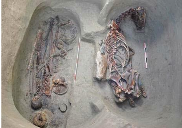
Fotoğraf 3: Kurgana İnsanla Birlikte At Gömüldüğünü Gösteren Bir Fotoğraf