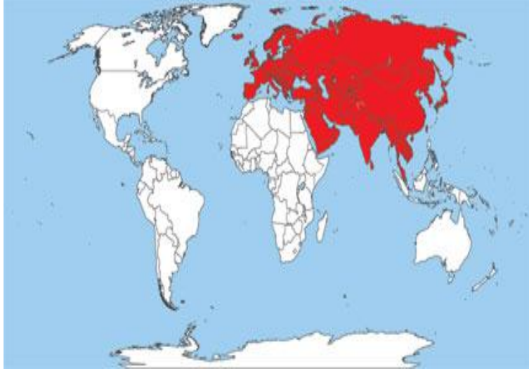
Harita 1: Avrasya Coğrafyası