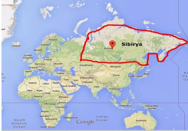
Harita 2: Sibirya Coğrafyası