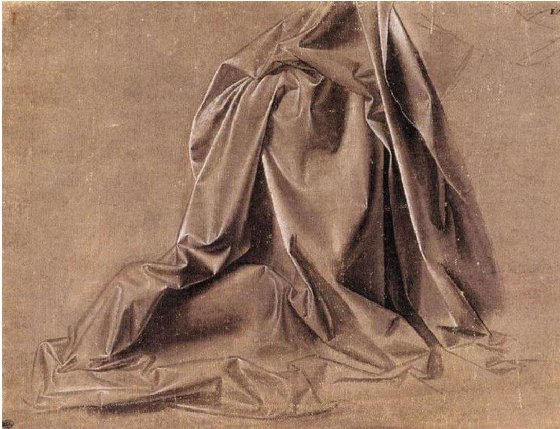
Resim 1. “Oturan Figür İçin Draperi”, 1470, Tuval Üzerine Tempera, 18.1 x 23.4 cm.

Leonardo’nun yetiştiği atölye ortamı çırağın fırçaya aşinalığı ve el ustalığı üzerine kuruludur. Ruskin’e göre; biz modernler çizme yoluyla resme geçerken eskiler resim yoluyla çizmesini öğreniyorlardı. “Fırça daha çocukken ellerine tutuşturuluyor, kalem ve tebeşir fırça hafifliği veya bir gravürcünün emniyetiyle kullanılıncaya kadar bu fırça ile çizmek zorunda kalıyorlardı” (Read, 2014, s. 60). Bu bağlamda daha küçüklükten beri el fırçaya alışmaktadır. Ayrıca Rönesans dönemi sanat atölyelerindeki çıraklar, kuyumcu atölyelerinde de çalıştırılırlardı (Bulut, 2003, s. 73). Ancak Leonardo bu salt beceriye yönelik eğitim yöntemini kendi merak duygusu ve araştırmacı kişiliğiyle aşmıştır.