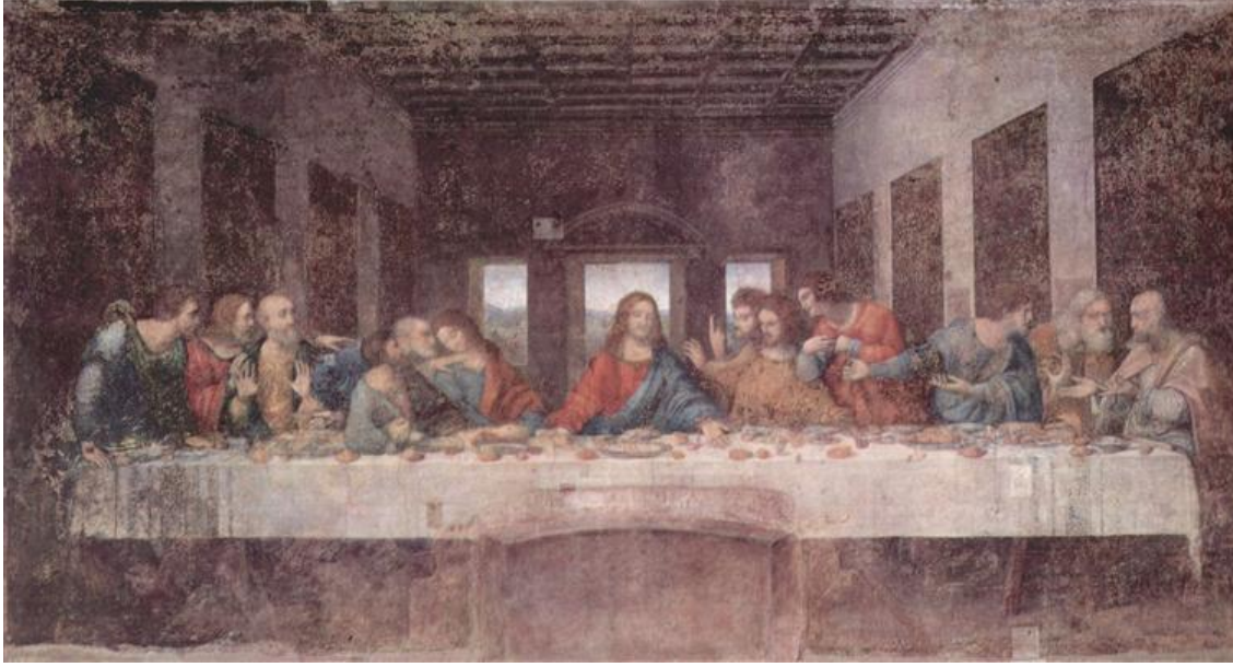
Resim 2. “Son Akşam Yemeği”, 1495, Tempera, 880 x 460 cm.

Desen eğitimi de Leonardo da Vinci için bilim seviyesindedir: “Desen Bilimi” tanımını kullanmıştır. Michelangelo ilk açılan sanat okulunu “Desen Okulu” olarak adlandırır. J. A. Ingres, “desen sanatın namusudur” demiştir. N. Poussin “Resimde bir fikri anlatan şey sadece desendir” açıklamasını yapar. Vincent van Gogh eskiz defterlerine desenleri aracılığıyla duygularını ifade etmiş olduğu notunu düşer (Bulut ve Alparslan, 2017, s. 388). Bu ifadelerden de anlaşılacağı üzere başta Leonardo da Vinci olmak üzere bir çok ressam, deseni resmin, yaratıcılığın ve ifadenin temeli olarak görmektedir.