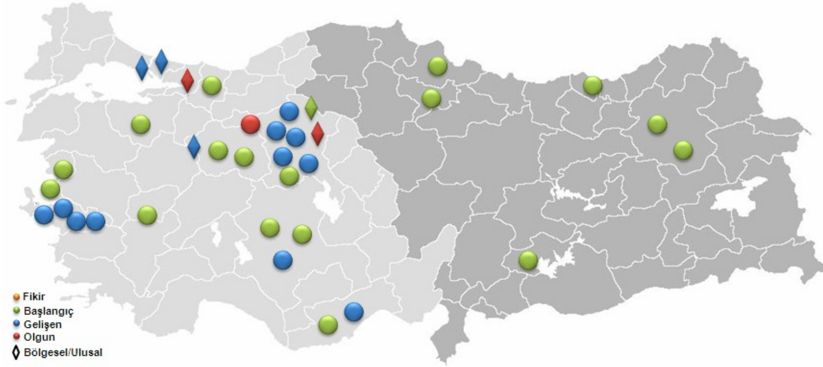
Şekil 2. Küme Haritası (Başlangıç, Gelişen ve Olgun Aşamadaki Kümeler) 4

Kaynak: T.C. Ekonomi Bakanlığı, İhracat Genel Müdürlüğü, KOBİ İşbirliği ve Kümelenme Projesi, Kümeler İçin Ortak Rekabet Alanları Stratejisi Raporu, 2012.