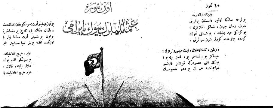
10 Temmuz 1324 tarihli Meşveret Gazetesi