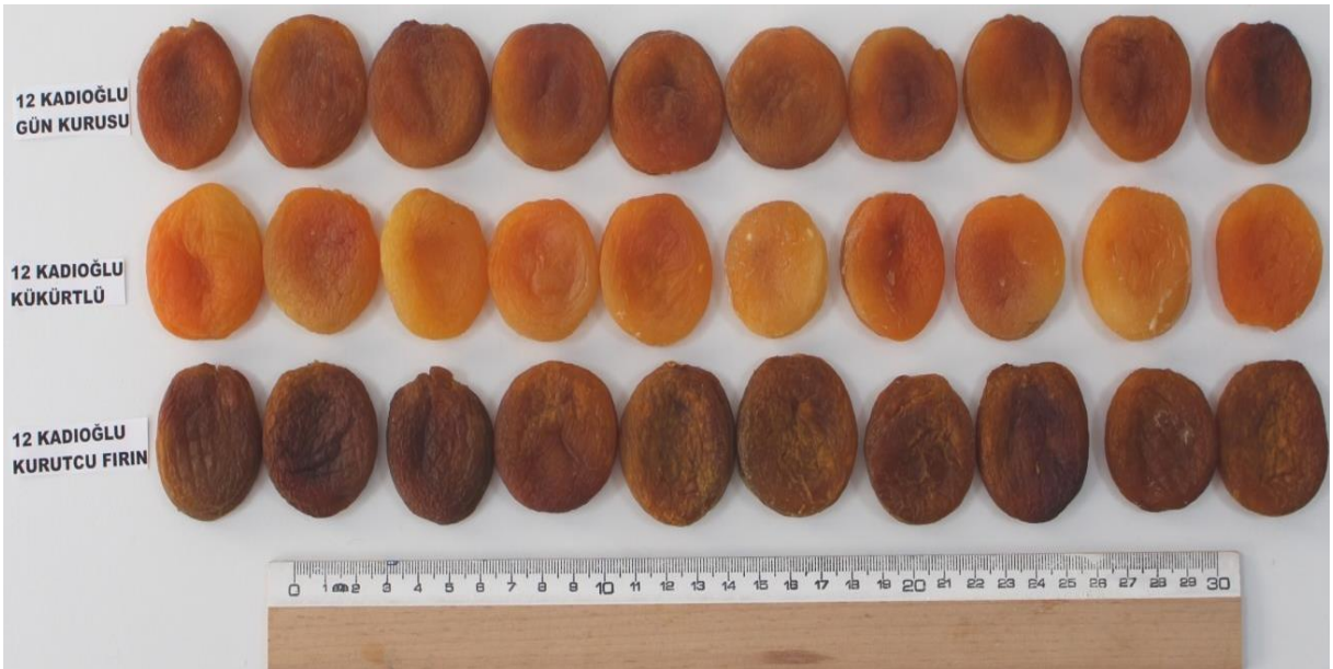
Şekil 1. Kurutuma yöntemleri sonucu kurutulmuş 12-Kadioğlu kayısı çeşidi

Malatya Kayısı Araştırma Enstitüsü Ülkesel Gen Kaynakları Parsellerinde bulunan kayısı örneği materyal olarak seçilmiştir (Şekil 1).