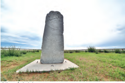
Görsel 4.14 Orhun Yazıtlarından biri (Moğolistan)

Türk kağanları ülkelerinde adaletin sağlanmasına büyük önem vermiştir. Orhun Kitabeleri'nde (Görsel 4.14) töre kelimesinin, on bir yerde geçmesi ve bunun altısının il ile birlikte kullanılmış olması bunun bir göstergesidir. Ayrıca devletin varlığını devam ettirmesi, törelere bağlılık ile ilişkilendirilmiştir. Devlet ile törenin eş değer olduğunu, abidelerdeki şu cümleler açıklamaktadır: "Ey Türk budunu (milleti), devletini, töreni kim bozabilir." Törenin en önemli değeri olan adalet de bu yüzden mülkün yani devletin temeli kabul edilmiştir. Devlet teşkilatlanmasında düzenleyici bir role sahip olan töre, kağanın hem keyfi hareket etmesini engellemiş hem de halkına adil davranması için bir kontrol mekanizması olmuştur.