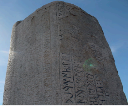
Görsel 2.12: Kök Türk Kitabeleri