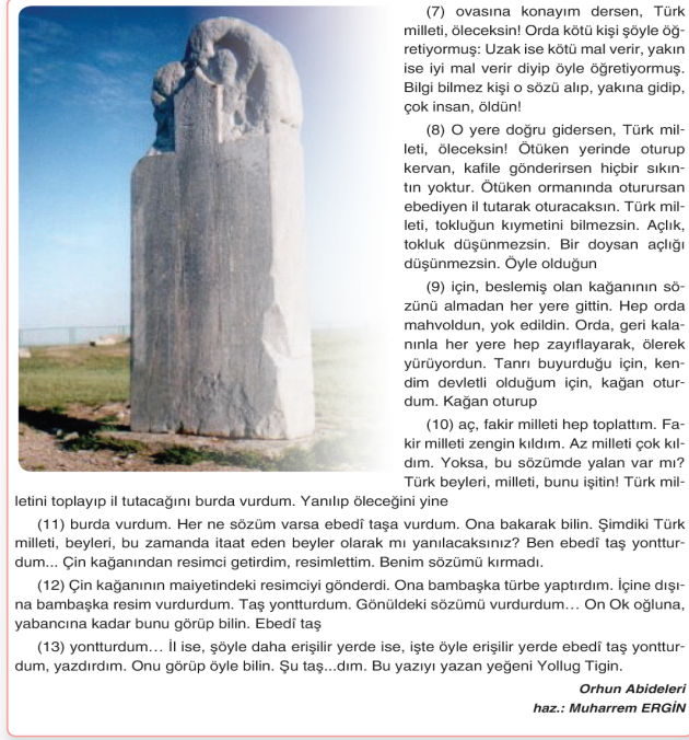
Görsel 9. 12. sınıf Türk Dili ve Edebiyatı ders kitabında Köl Tigin Yazıtı'nın batı yüzüne ait görüntü (s. 249)