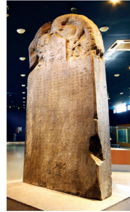
Görsel 1.7 Moğolistan-Höşöö Tsaydam Müzesindeki Kültigin Yazıtı

Tarihte "Türk" adının geçtiği yazılı ilk metinler Orhun Kitabeleri'dir (Görsel 1.7). Bu kitabeler hakkında ilk bilgiler XIII. yüzyılda yaşayan Cuveynî'nin "Tarih-i Cihangüşa" isimli eserinde yer alır. Cuveynî, eserinde Uygur bölgesini gezerken rastladığı garip işaretlerle yazılmış taşlardan söz etmektedir. Daha sonra Danimarkalı Messerschmidt'in (Mesirşmit) 1721'de bu eseri görebilerek Avrupa bilim camiasına tanıtması üzerine birçok bilim adamı bu yazıların kime ait olduğu hakkında tahminlerde bulunmuştur. Bu bilim insanlarının bazıları bu yazıların; Prusyalılara, İskitlere, Yunanlara ve Latinlere ait olduğunu ileri sürmüştür. Bölgeye giden birçok araştırmacı burada kazılar yaparak yeni kalıntılar tespit etmiştir. Kitabelerin okunuşunu ilk çözen Danimarkalı Dil Bilimci W. Thomsen (V. Tomsen) olmuş ve bu abidelerin Türklere ait olduğunu tüm dünyaya duyurmuştur. Orhun Kitabeleri hakkında yapılan bilimsel çalışmaların sonucunda; Türklerin yaşantılarına, töresine, kültürüne ve devlet yönetimine dair bilgiler bulunmuştur (Gömeç, 2000, s.64-65'ten düzenlenmiştir).