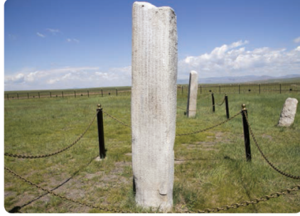
Görsel 8. 12. sınıf Türk Dili ve Edebiyatı ders kitabında Bilge Tonyukuk Yazıtlarına ait görüntü (s. 20)

Bir dildeki değişim çoğunlukla konuşma dilinde başlayıp daha sonra da yazı dilini etkiler. Çünkü konuşma dilindeki değişim yazı diline oranla daha hızlı olur. Yazı dili durağan, konuşma dili ise dinamik olduğu için zamanla yazımla söyleyiş arasındaki fark büyür ve yazı dilinde reform yapma ihtiyacı ortaya çıkar.