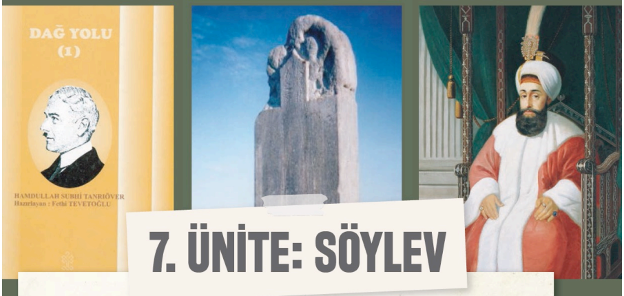
Görsel 10. 12. Sınıf Türk Dili ve Edebiyatı ders kitabında Köl Tigin Yazıtı'nın batı yüzüne ait görüntü (s. 263)