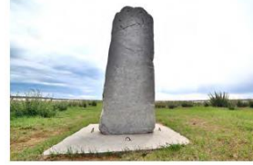
Görsel 6.4: Bilge Kağan Yazıtı

Eski Türk devletlerinde adalet bir devlet töresiydi. Hakan bile kanuna aykırı davranırsa cezalandırılırdı. Türk kültüründe "meşveret" kavramı vardır. Meşveret akıl toplamak demektir. Yani en doğruyu bulmak için birilerine danışılmasıdır. Bu işlem kurultayda yapılırdı. Kurultayda devletin siyasi, askerî ve ekonomik konuları ile ilgili görüşmeler yapılır, kararlar alınır. Kurultaya hakanın eşi de katılırdı.