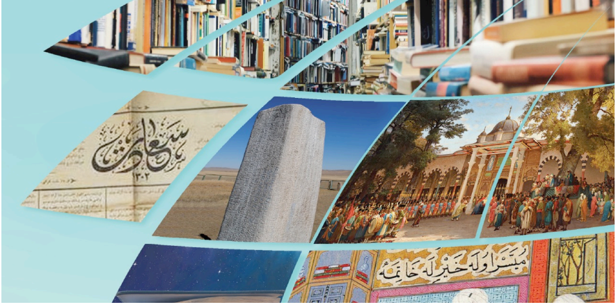
Görsel 7. 11. Sınıf Türk Dili ve Edebiyatı ders kitabının kapağındaki Bilge Tonyukuk Yazıtlarından birincisine ait görüntü