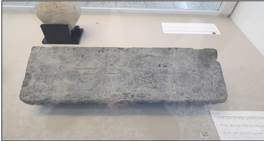
Resim 4: Fratraka Tapınağı'nda bulunan yazıt, İran Milli Müzesi, Tahran. Yazıtın üzerinde, DÍOS MEGÍSTOU (ΔΙΟΣ ΜΕΓΙΣΤΟΥ) kelimesi yazılmıştır. Adı geçen kelime Zeus Megistos anlamındadır.