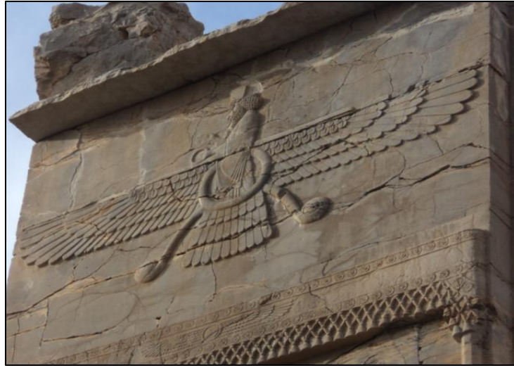
Resim 3: Far (Khovarne), Persepolis, İran, Alireza Shapur Shahbazi yorumuna göre, Persepolis ve Akhamenid İmparatorluğu'nun başka yerleşimlerinden bildirilen bu simge Far ya da Khovarne'yi temsil etmektedir, (Resim: Farzad Abedi).

IV. Orontes döneminden itibaren, kademeli olarak, Philo-Hellenism (Yunan-Severlik) kanıtları, özellikle kült kapsamında, Kommagene sınırlarında ortaya çıkmakta ve bazı Yunan tanrılarının heykelleri ( Zeus, Artemis, Herakles, ve Apollon ) yeni kurulan Bagaran kentinde dikilmiştir (Horenli Musa. 2. 4). Bagaran adı, Eski Persçe'de Tanrı anlamına gelen Baga sözcüğünden türetilmiştir (Garsoian, 1997: s. 51).