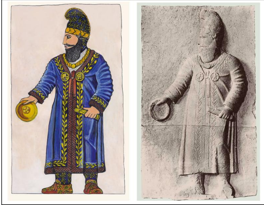
Resim 1: Nemrut Dağı'nın batı tarafında bulunan I. Akhemenid Kserkses'in steli (sağ) ve renkli rekonstrüksiyonu (sol) (Brijder, 2014, Fig. 68a–b)