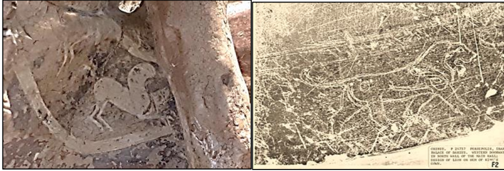
Resim 6: Sol: Zeus ve Ganymedes Terrakottası'nda Zeus'un elbisesinin kenarındaki kanatlı canavar biçimli bezemeler, Olympia Müzesi, Yunanistan, (Resim: Farzad Abedi) , Sağ: Persepolis Tachara Binsı'ndaki Akhemenid İmparator'un elbisesinin kenarındaki aslan biçimli bezemeler (ORINST, P 24757 15 )

Ganymedes'in mitsel kişiliği de Pers ve Doğu ile ilişkisiz değildir. Ganymedes, Troia'yı kuran Tros 'un oğludur. İlos , onun kardeşi ve Tithonus , Priamos ve Klytios 'un dedesidir. Bu makalenin yazarının başka bir çalışmasında Ktesias tarafından aktarılan Tithonos ve onun oğlu, Memnon anlatıları detaylı bir şekilde incelenmiştir. Sözü edilen öykü, Tithonos 'u Assur İmparatorluğu 'nun Persli komutanı bilmektedir (Diodoros. 2.