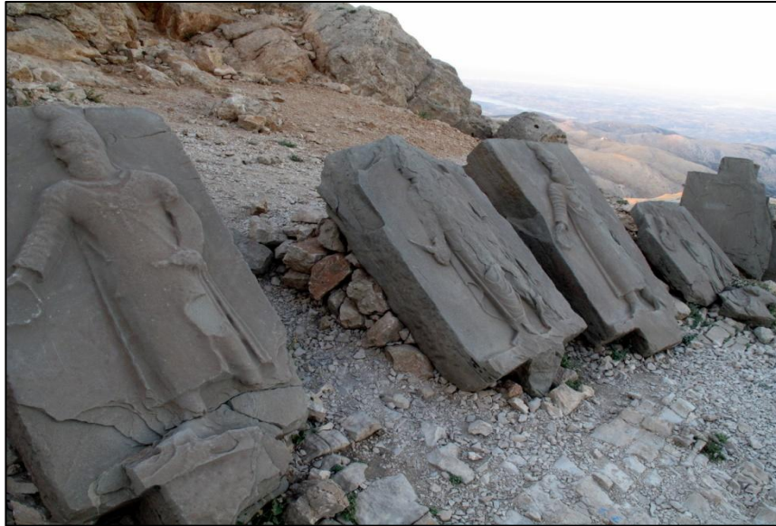
Resim 2: Nemrut Dağı'nın batı tarafında bulunan (soldan sağa) I. Darcios, Ermenli Satrap [Bar?] danes, I. Kserkses ve II. Artakserkses stelleri..