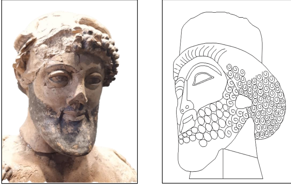
Resim 5: Sol: Zeus ve Ganymedes Terrakottası'nda Zeus'un başı, Olympia Müzesi, Yunanistan, (Resim: Farzad Abedi), Sağ: Brüksel koleksiyonundaki Persli Prens başından bir çizim, (Çizim: Farzad Abedi).

Ganymedes'i çalma hâlinde tasvir etmektedir.