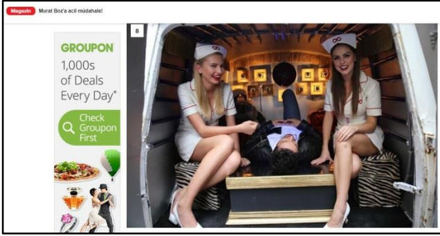
Ekran Görüntüsü 10- Hürriyet Gazetesi internet sitesinde yer alan haber

Filmin bu sahnelerinin medyada yer almasının ardından yine Hürriyet Gazetesi'nin internet sitesinde yer alan haberde mini etekli hemşirelerin Murat Boz'a müdahale ettiği sahnelerin sağlık çalışanlarının tepkisine yol açtığı belirtildi. Sağlık Sen İzmir 1 Nolu Şube Başkanı Özgür Yıldırım'ın ifadelerine yer verilen haberde şu metin yer almıştır: