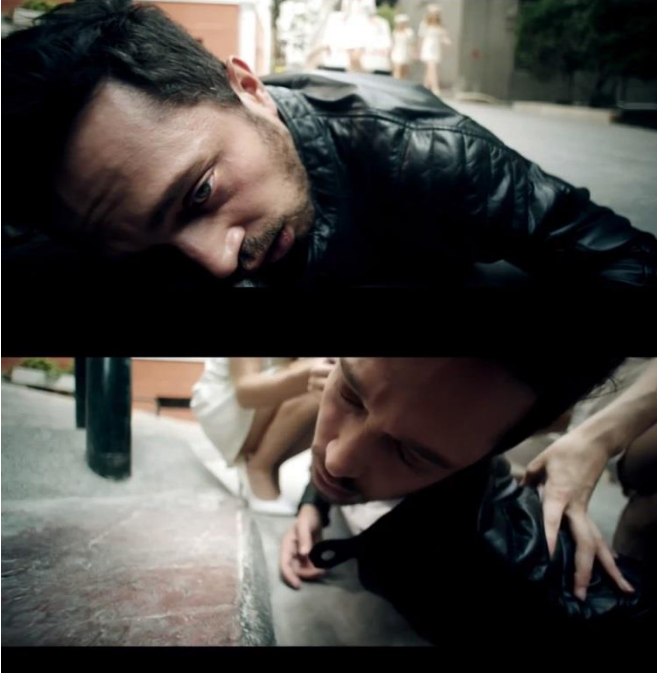
Ekran Görüntüsü 4-5 Dönerse Senindir isimli sinema filminin tepki çeken sahneleri bu görüntüler ile başlamaktadır.

Filmin tepki çeken sahnelerine ilişkin alınan ekran görüntüleri ise aşağıdadır.