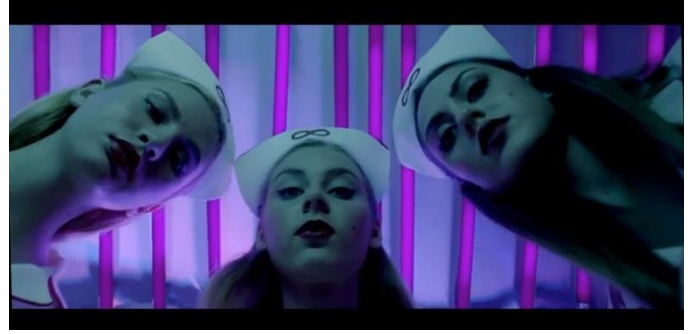
Ekran Görüntüsü 8- Tepki çeken diğer sahneler

Filmin kamera arkası görüntüleri olarak verilen ve medyada yer alan görüntülerin de ilgili sahnelerle alakalı olduğu görülmektedir. Aşağıda 13.11.2016 tarihli Hürriyet Gazetesi'nin internet sitesinde yer alan ve "Murat Boz'a acil müdahale!" başlığını taşıyan haber ve görseller yer almaktadır.