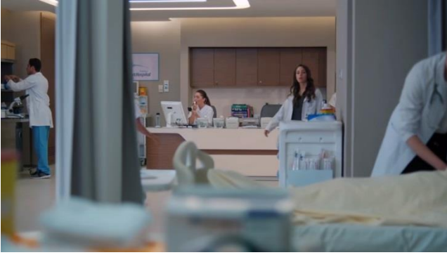
Ekran Görüntüsü 1- Kalp Atışı dizi filminden ilgili sahne

Tepki çeken sahneler dizinin bu bölümünün 22. dakikası ve 53. saniyesinde başlamakta ve 23. dakikası 35. saniyesinde sona ermektedir. (www.showtv.com Erişim Tarihi: 30.10.2019)