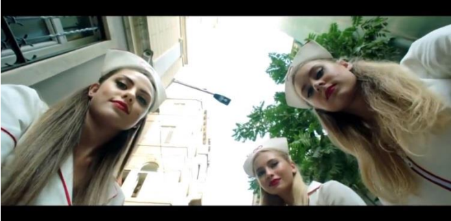
Ekran Görüntüsü 6- Tepki çeken diğer sahneler

Filmde ilgili sahnelerinin kurgusundan hemşirelerin cinsel bir obje olarak sunulduğu görülmektedir. Hemşire imajının popüler kültür içinde yeniden kurgulanarak verilen sahnelerdeki akış içerisinde seyirlik bir obje haline getirildiği barizdir.