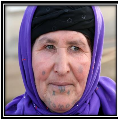
Resim2 (Redhamiyet: ٧)

Görüşleri alınan G12, G13, G1 kaynak kişileri de bu hikâyeyi doğrulamıştır. Bu hikâye doğrultusunda onlara göre tek helal dövme de alt dudaktaki redhamiyettir (G1, 09. 09. 2016, G12, G13, Kişisel Görüşme,12. 09. 2016) .(Resim2, Resim3, Resim4, Resim5 )