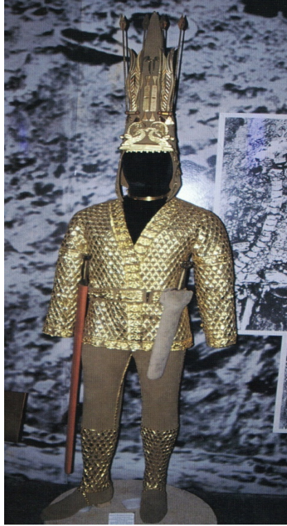
Resim-1: Altın Elbiseli Adam (Kazakistan Ulusal Müzesi)

Esik Kurganında bulunan ve M.Ö. 4. yüzyıla tarihlendirilen genç ve soylu bir kişinin mezarında bulunan silah ve zırh giyimlerinin zenginliği nedeniyle literatüre “altın elbiseli adam” olarak geçen buluntuların soylu bir alp mezarı olduğunu iddia eden çalışmalar bulunmaktadır. 1999 ve 2003 yıllarında yine Kazakistan’ın değişik bölgelerinde bu kıyafetlere benzer iki soylu kıyafeti daha bulunmuştur.