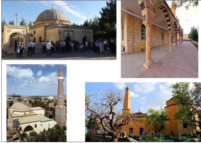
Şekil 7. Siirt ili türbelerinden bazıları (Orijinal, 2018)

Türbesi, Gusir Höyük, Ulu Cami ve Cumhuriyet (Hıdr-ul Ahdar) Cami gelmektedir (Şekil 7) (Anonim, 2019a). Ayrıca milattan önceki devirlerde yapılan ve “zor geçit” anlamına gelen Akabe Yolu da Siirt’te bulunmaktadır.