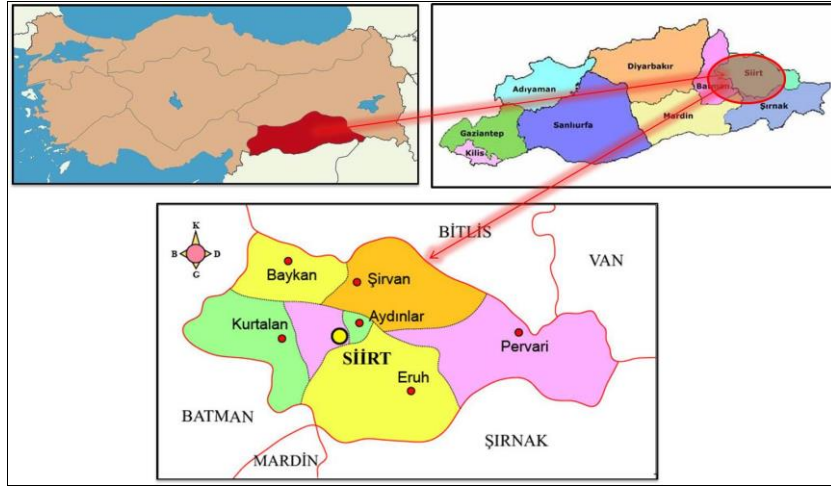
Şekil 1. Siirt ilinin coğrafi konumu

Araştırma alanının seçiminde Siirt ilinin doğal, kültürel, tarihsel ve dinsel özellikleri, bölgede yer alan ve turizm açısından dikkat çeken merkezlere yakınlığı, kırsal turizm ve diğer alternatif turizm çeşitleri için uygun bir potansiyele sahip olması ve yöre halkı için bir başka ekonomik gelir kaynağı oluşturacağı düşüncesi etkili olmuştur. Alanla ilgili özellikler Orman ve Su İşleri Bakanlığı (2014), Çevre ve Şehircilik Bakanlığı (2013), Doğa Koruma ve Milli Parklar Genel Müdürlüğü (2013), Meteoroloji Genel Müdürlüğü (2014), TÜBİVES (2015), Siirt Valiliği (2015), Siirt Belediyesi (2017), TÜİK (2018), GAP Bölge Kalkınma İdaresi Başkanlığı (2015) tarafından yapılan çalışmalardan, literatür taramalarından, yöre halkı ile yapılan görüşmelerden ve gözlemlerden elde edilen verilerle ortaya konulmuştur.