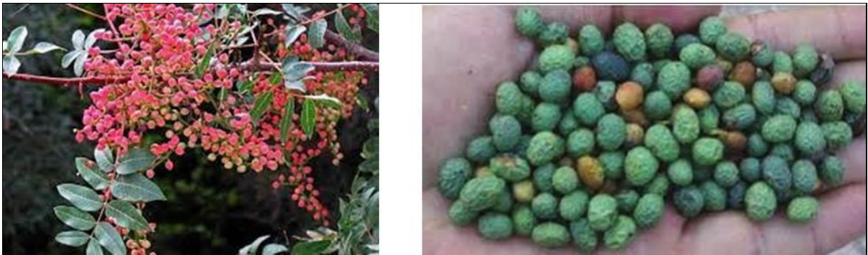
Şekil 4. Pistacia khinjuk (Anonim, 2019b)

TÜBİVES (2015) verilerine göre Siirt'te 320 bitki taksonu tespit edilmiş olup bunlardan 43 adedi endemik tür olarak tescillenmiştir. 2017 yılında ise Siirt'in Pervari ilçesinde, Allium pervariensis adı verilen yeni bir endemik tür tespit edilerek kayıt altına alınmıştır (Anonim, 2018). Bu endemik türler arasında özellikle Salvia siirtica (Siirt adaçayı) ve Hycintella siirtensis (Siirt kopçası), Fritillaria imperialis (Ters lale) ve Populus fratica (Fırat kavağı) en fazla bilinen türlerdir.