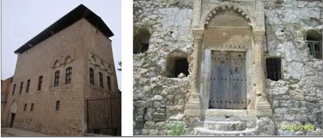
Şekil 2. Cas evleri (Anonim, 2013b)

Yaklaşık olarak %35'i orman ve koruluklarla kaplı olan il orman varlığı bakımından zayıf bir karakter göstermektedir. Bu alanların % 75'i boşluklu kapalı kuru ve geri kalanı ise normal kapalı kuru ve orman şeklindedir. Çayır ve mera alanlarının oranı %6 civarındadır. En sık rastlanan orman ağacı türü Quercus brantii (İran palamut meşesi)'dir (Anonim, 2013a). Siirt fıstığı adıyla bilinen Pistacia vera L. (Şekil 3) türü ile bittim adıyla bilinen Pistacia khinjuk (Şekil 4) da ilde yaygın olarak bulunan ve yöre halkı tarafından özellikle ekonomik amaçla yetiştirilen türlerdir. Bu türlerin dışında söğüt, kavak, karaçam, çınar, ardıç, sumak gibi türler bulunmaktadır.