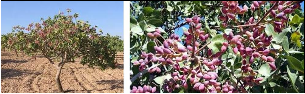
Şekil 3. Pistacia vera L. (Anonim, 2019b)

Yaklaşık olarak %35'i orman ve koruluklarla kaplı olan il orman varlığı bakımından zayıf bir karakter göstermektedir. Bu alanların % 75'i boşluklu kapalı kuru ve geri kalanı ise normal kapalı kuru ve orman şeklindedir. Çayır ve mera alanlarının oranı %6 civarındadır. En sık rastlanan orman ağacı türü Quercus brantii (İran palamut meşesi)'dir (Anonim, 2013a). Siirt fıstığı adıyla bilinen Pistacia vera L. (Şekil 3) türü ile bittim adıyla bilinen Pistacia khinjuk (Şekil 4) da ilde yaygın olarak bulunan ve yöre halkı tarafından özellikle ekonomik amaçla yetiştirilen türlerdir. Bu türlerin dışında söğüt, kavak, karaçam, çınar, ardıç, sumak gibi türler bulunmaktadır.