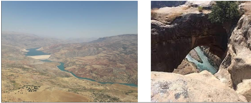
Şekil 6. Botan Vadisi ve Deliklitaş (Orijinal, 2018)