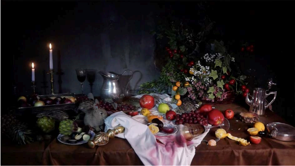
Şekil 8: Elif Boyner, İsimsiz (Tavşan) , 2014, Video, 17' (URL-8).

Hareketli Natürmortlar başlıklı üçlemeyi Tayfun Serttaş bloğunda bulunan sergiyle ilgili yazısında, (...) resim, fotoğraf ve video dili arasındaki geçirgenliği klasik görsel tarihin güzergâhlarından geçerek sorguluyor” (Serttaş, 2015) sözleriyle açıklar. Bu çalışma, ilk bakışta klasik bir natürmort resmi olarak düşünülebilir. Oysa, meyveler, sebzeler, yemekler gibi çeşitli nesnelere oluşan, şaşalı bir yemek masasını temsil eden bu natürmort görüntüsündeki tavşan, istakoz, salyangoz gibi canlılar; hareketlidir ve masadaki yiyecekleri yemektedirler.