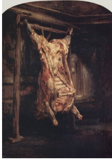
Şekil 1: Rembrant Harmenszoon Van Rjin, Siğir İskeleti , Tuvale Yağlıboya, 1657, 94 x 67 cm (URL-1).