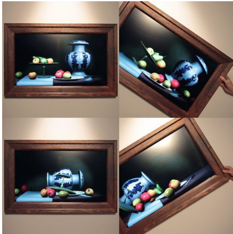
Şekil 5: Scott Garner, Natürmort , video yerleştirme, 2012 (URL-5).

Scott Garner’ın Natürmort isimli çalışması tam olarak böyle bir konunun gündemi olabilir. Sanatçı çeşitli meyveler, tabak, vazo gibi nesnelere sıradan bir natürmort kompozisyonu kurar. İlk bakışta duvara asılmış, çerçeveli klasik bir natürmort olan bu görüntü bir televizyon ekranındaki görüntüdür aslında. Garner, geleneksel bir natürmort kompozisyonunu, ekran aracılığıyla izleyicinin algısını şaşırtacak bir güncelliğe kavuşturmuştur. Bu çalışmada geleneksel olanın teknolojiyle buluşmasının yanı sıra ezber bozan bir taraf da, çerçeveyi ne tarafa çevirirseniz ekran içindeki meyvelerin, o tarafa hareket etmesidir. Çalışma izleyicinin katılımıyla yerçekiminin potansiyel gücünü harekete geçirerek işlemektedir. Aynı zamanda bu çalışma, ölü doğanın durgunluğunun aksine akıp giden bir zamanın izlerini barındırmaktadır.