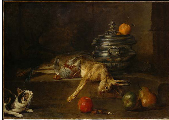
Şekil 4: Baptiste Siméon Chardin, Gümüş Çorba Kâsesi , tuvale yağlıboya, 1728, 76.2 x 108 cm (URL-4).

18.yy a ait bu iki resmi referans olarak bugüne geldiğimizde natürmortu tekrar mercek altına almak gerekir. Çünkü bugün natürmort, sadece ölü ve durgun doğaya dair değil canlı ve hareketli bir doğaya da dairdir. Bu sebeple, natürmort sadece ölü hayvanları, cansız nesnelere ele alır demek yetersiz olabilir. Bu tanım geleneksel sınırlar içerisinde kalabilir.