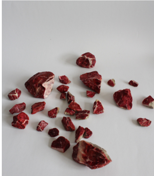
Şekil 1: Necla Rüzgar, Mücevherler , 2013, taş ve yağlı boya, muhtelif ölçülerde (URL-7).

Görsel 7'de yeni kesilip parçalanmış bir hayvanın etlerinin sıcaklığını hissettiren çalışma, bulunmuş taşların et şeklinde boyanmasıyla elde edilmiştir. Çalışma, doğadan alınmış nesnenin yenilebilir bir doğa biçimine dönüştürülmesi şeklinde var edilerek mekanda hayat bulmuştur. Sert ve soğuk taşlar; sıcak, yumuşak ve taze bir et görüntüsündedir. Bu etlerin, Aertsen'in yiyeceklerle donattığı natürmort tablolarındaki etlerden ikna edicilik açısından bir farkı yoktur denilebilir. Günümüz sanatçısında natürmort, anlam, içerik ve bağlam olarak güncellenmiştir.