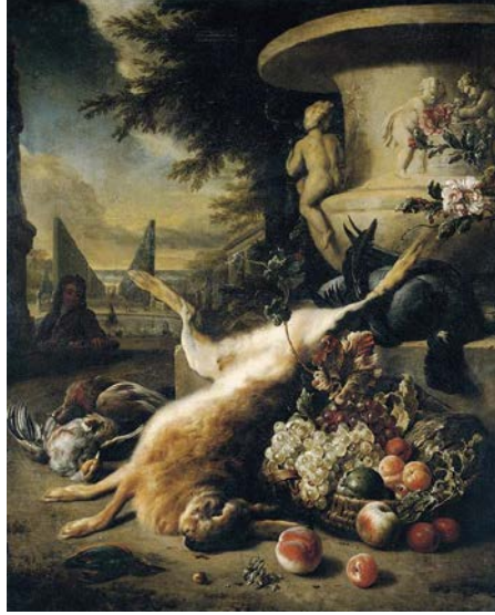
Şekil 3: Jan Wennix, Natürmort , 1706, tuvale yağlıboya, 123 x 100 cm (URL-3).

Bir natürmortu anlatırken sanatçının kullandığı nesnelere bahsedilir. Elma, armut, üzüm, tabak, örtü vs. görüldüğü söylenir. Peki, Jan Weenix'in bu nesnelere arasında boylu boyunca duran ölü tavşanına ne denir? Şüphesiz o da elma, armut gibi cansız bir nesnedir. Bir sanatçının natürmortuna konu olan nesnelere biridir. Tıpkı Jean Baptiste Siméon Chardin' in Gümüş Çorba Kâsesi resmine konu olan dipdiri, kanlı canlı kedisi gibi bir natürmort nesnesidir. Burada canlı ya da cansız olsun kedi de tavşan da iki boyutlu bir yüzeydeki görüntülerdir. İkisinde de kendi türlerinin özelliklerine dayanarak kedi ya da tavşan özelliğinden hiçbir şey kaybettirilmediği kabul edilebilir.