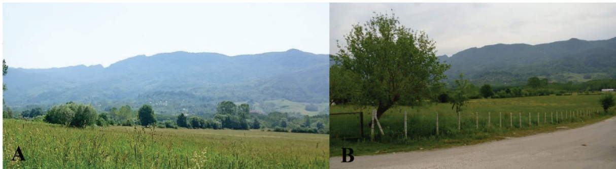
Şekil 3. Mera alanından görünüş 2016 (A) ve 2019 (B)

Karışımında kullanılan türler Bartın doğal florasında yer alan yem değeri yüksek, hayvanlar tarafından sevilen azalıcı gruba aittir. 2019 yılında yapmış olduğumuz çalışmanın sonuçlarına göre; mera alanında 13 familyaya ait 27 bitki taksonu belirlenmiştir. Bu bitkilerin 8 tanesi (% 29.63) azalıcı, 2 tanesi (% 7.41) çoğalıcı ve 17 tanesi (% 62.96) istilacı grupta yer almaktadır. Islah çalışmasının bitmesinden sonra azalıcı gruba ait türlerin botanik kompozisyonda (% 29.63) yer alması, mera alanının iyi olduğunun bir göstergesidir. Ancak mera vejetasyonunun %62.96'sı istilacı türlerden meydana gelmiş olsa da bunların botanik kompozisyona katılma oranları % 27.09'dur. İstilacı türlerin oranının yüksek olması meranın botanik kompozisyonunun bozulmaya başladığının bir göstergesidir.