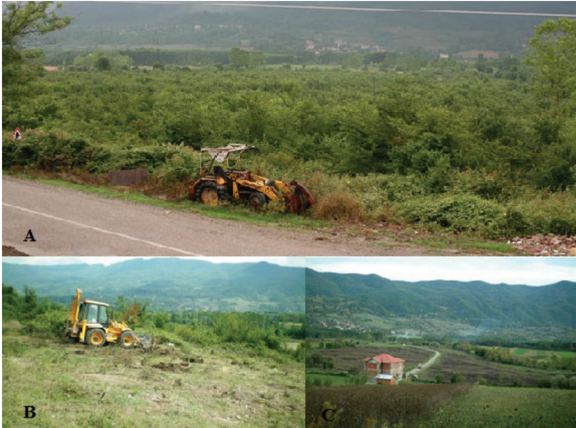
Şekil 2. Serdar köyü mera alanının 2008 yılında ıslah yapılmadan önce (A, B) ve sonraki (C) durumu (Foto: Bartın Tarım İl Müdürlüğü, Mera Birimi).

Karışımında kullanılan türler Bartın doğal florasında yer alan yem değeri yüksek, hayvanlar tarafından sevilen azalıcı gruba aittir. 2019 yılında yapmış olduğumuz çalışmanın sonuçlarına göre; mera alanında 13 familyaya ait 27 bitki taksonu belirlenmiştir. Bu bitkilerin 8 tanesi (% 29.63) azalıcı, 2 tanesi (% 7.41) çoğalıcı ve 17 tanesi (% 62.96) istilacı grupta yer almaktadır. Islah çalışmasının bitmesinden sonra azalıcı gruba ait türlerin botanik kompozisyonda (% 29.63) yer alması, mera alanının iyi olduğunun bir göstergesidir. Ancak mera vejetasyonunun %62.96'sı istilacı türlerden meydana gelmiş olsa da bunların botanik kompozisyona katılma oranları % 27.09'dur. İstilacı türlerin oranının yüksek olması meranın botanik kompozisyonunun bozulmaya başladığının bir göstergesidir.