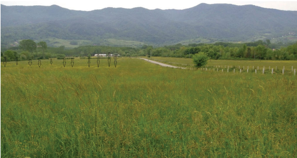
Şekil 5. Ranunculus constantinopolitanus yoğunluğunun değişimi

Mera alanının üniform bir şekilde otlatılmadığı Şekil 5. de görülmektedir. Buna bağlı olarak mera alanının bazı kesimlerinde R. constantinopolitanus 'un oranının arttığı görülmektedir.