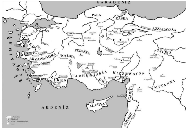
Figür 2: MÖ 2. Binyılda Anadolu Haritası (Alparslan, Yazılı Belgeler Işığında Hitit Devleti ile Ege Dünyası Arasındaki Siyasal İlişkilere Toplu Bakış , İstanbul Üniversitesi Sosyal Bilimler Enstitüsü Yayınlanmamış Yüksek Lisans Tezi, İstanbul, 2000).