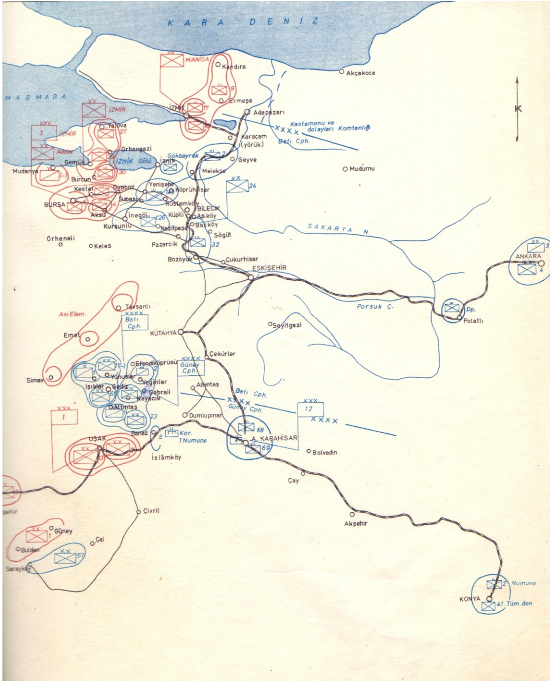
Bursa'nın işgali sonrası Batı Cephesi'nde genel durumu gösteren kroki.