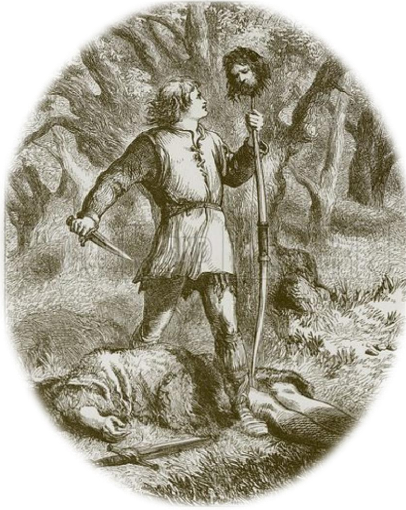
Şekil 2: Robin Hood ve Gisbornelu Guy. 47