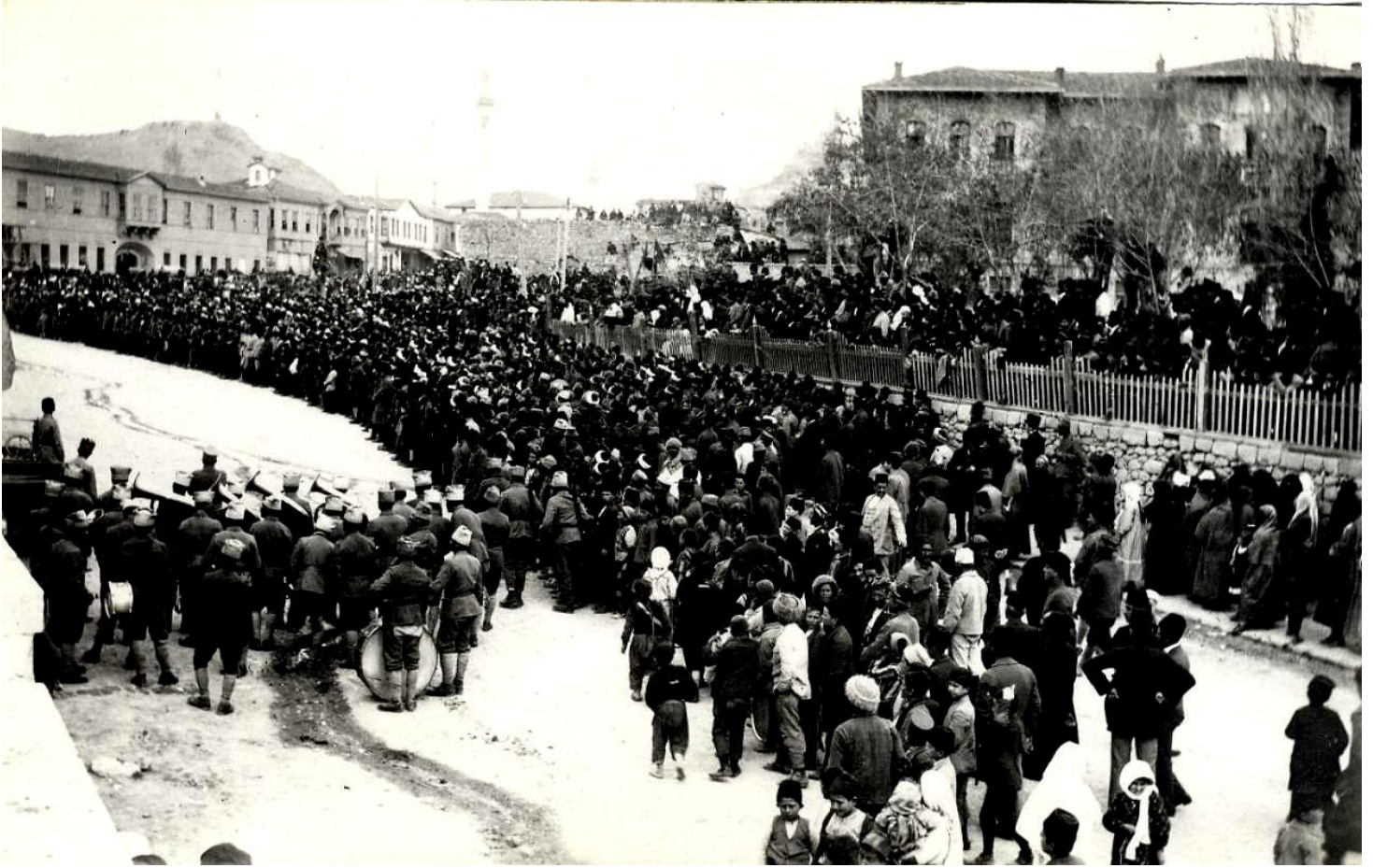
Edirne'nin işgali nedeniyle, Büyük Millet Meclisi önünde yapılan miting fotoğrafı, (Temmuz 1920)