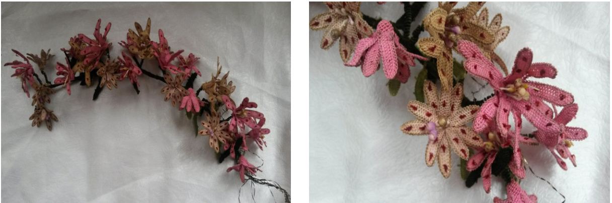
Fotoğraf 2: Lale Oyası Fotoğraf 2a: Detay görünüm (Kaynak Kişi: Hülya Atalay)

Gül oyası, seksen yıl önce yapılmış bir taç oyasıdır. Taç gülü, baş gülü de denilmektedir. Gelin tacı olarak kullanılmaktadır. Gül oyasında, ipek iplik ile krem, pembe, yeşil, siyah renkler, at kılı, ince tel, kalın tel kullanılmıştır. Üçgen ve kare ilmek ile bitkisel ve geometrik motifler kullanılarak yapılmış, üç boyutlu bir oyadır. Yaprak kenarları, dik durmaları için at kılı ile çevrilmiştir. Saplar üzerine, yedi adet gül çiçekleri ile çevresine tomurcuklar ve dörtgen şeklindeki yapraklar ana-ara motifin aralıklı tekrarı olarak yerleştirilmiştir.