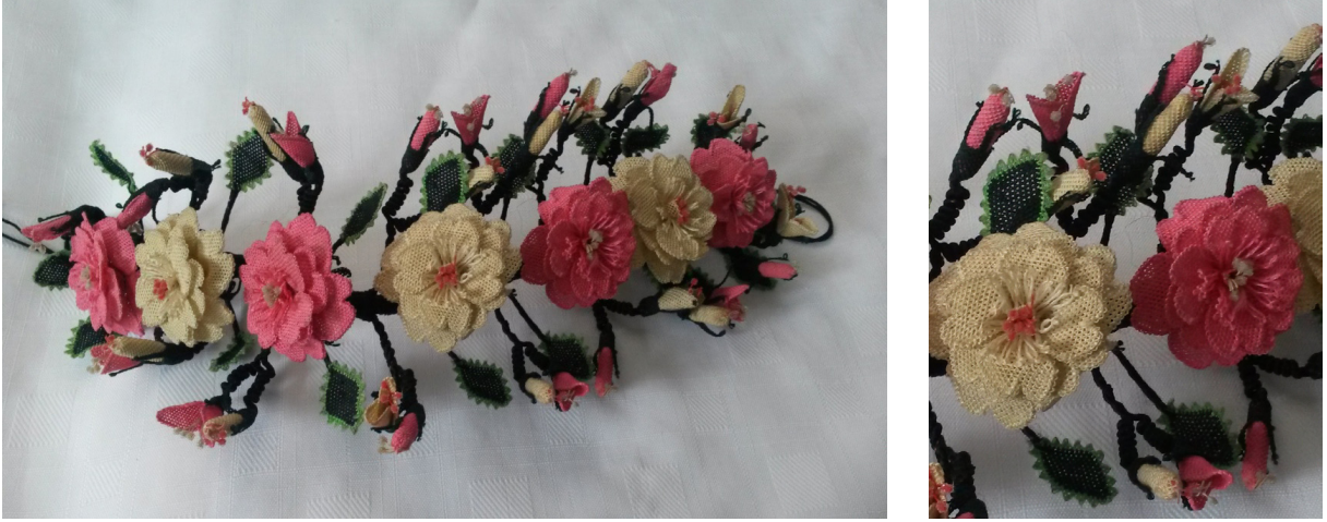
Fotoğraf 1: Gül Oyası Fotoğraf 1a: Detay görünüm (Kaynak Kişi: Nurten Güner)

Gül oyası, seksen yıl önce yapılmış bir taç oyasıdır. Taç gülü, baş gülü de denilmektedir. Gelin tacı olarak kullanılmaktadır. Gül oyasında, ipek iplik ile krem, pembe, yeşil, siyah renkler, at kılı, ince tel, kalın tel kullanılmıştır. Üçgen ve kare ilmek ile bitkisel ve geometrik motifler kullanılarak yapılmış, üç boyutlu bir oyadır. Yaprak kenarları, dik durmaları için at kılı ile çevrilmiştir. Saplar üzerine, yedi adet gül çiçekleri ile çevresine tomurcuklar ve dörtgen şeklindeki yapraklar ana-ara motifin aralıklı tekrarı olarak yerleştirilmiştir.