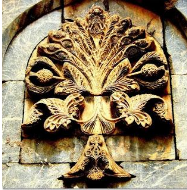
Resim 3.

“Hayat Ağacı”efsaneler dışında sanat yapıtlarına da konu edilmiş, hatta bu konuda “Hayat Ağacı”işlenmesinin ilk örneklerine, M.Ö. 3 bin yılında Aşağı Mezopotamya'da rastlanmaktadır. İki Teke arasındaki çalı motifi sahnesi, Sümerlerin“yaşam” ve “ölüm” arasındaki sürekli dolaşım, yeraltı dünyası ile olan inançların ve “Hayat Ağacı”nın en eski şekli "dumuzi"yi simgeleyen büyük Ana Tanrıça'nın hayatı yayan “âşıklar çifti”nin ölüp, ilkbaharda yeniden dirilmesini sembolize etmektedir. Bu inanç geleneğiyle ilgili olarak, dönüşümlü yaşamın simgesi “Hayat Ağacı” motiflerinin çeşitli ve zengin şekillerine, Urartu'lardan önce Asurlarda da rastlamak mümkündür.