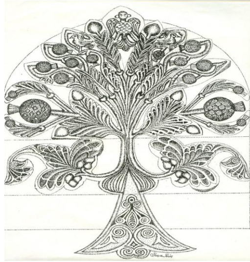
Resim 1. Ahmet Yaşar Serin’in “Hayat Ağacı”yla ilgili karakalem çalışması 16