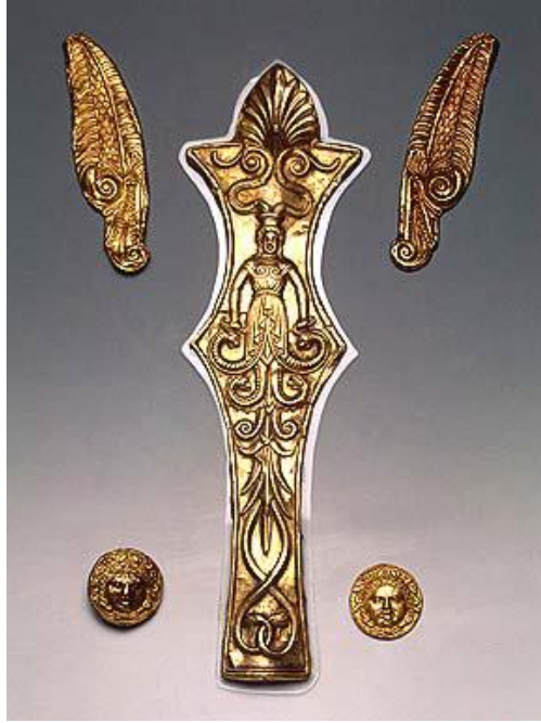
Resim 2. http://www.yenidenergenekon.com/381-dede-korkut-hikayelerinin-plastik-sanatlara-yansimasi

Kadın figürü tüm ilkel toplumlarda bereket, doğurganlık, sonsuz yaşamınsimgesi haline gelmiştir. Ağaç ise kökleri ile yerin derinliklerine, budaklarıyla göklere uzanarak, yer ve gök arasında duran ve bu iki unsuru birbirine bağlayan, aynızamanda hayatı ve ölümü, canı ve ruhu, karanlığı ve ışığı kendinde birleştiren evrensel, kozmik bir varlıktır. 19 Bu açıdan baktığımızda ağaç sonsuz hayatı, yaşam sürekliliği simgeselliği ile kadın sembolizmiyle örtüşmektedir. Yakutlar Ağacın her şeyin anası olduğuna inanıyorlardı. Yine Yakutlarda doğum ve hayat tanrıçası olan Humayana kutsal kayın ağacı altında oturmakta ve çocuk sahibi olmak isteyen kadınlar bu ağaca tapınarak ona kurbanlar adamaktaydılar. Yakut kadınlarının üzerlerinde Umay Ana'nın sembolü olan ağaçta boncuk bulundurdıkları dabilinmektedir. 20