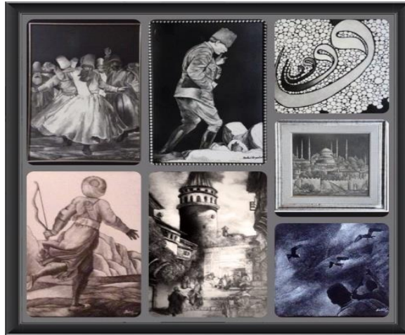
Sır Üstü Sgraffito Çalışmaları