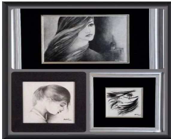
Sır Üstü Sgraffito "Kadın Temalı" Eserler