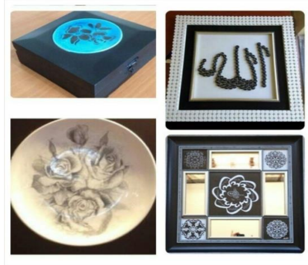
Sır Üstü Sgraffito “Çeşitli Dekorasyonlar”