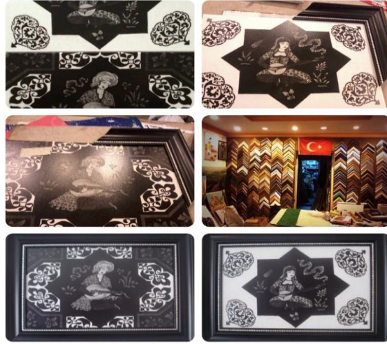
Ek 3: Sgraffito Eserlere Çerçeve Seçimi