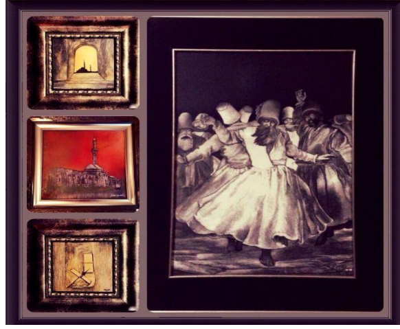
Sır Üstü Sgraffito “Renkli Çalışmalar”