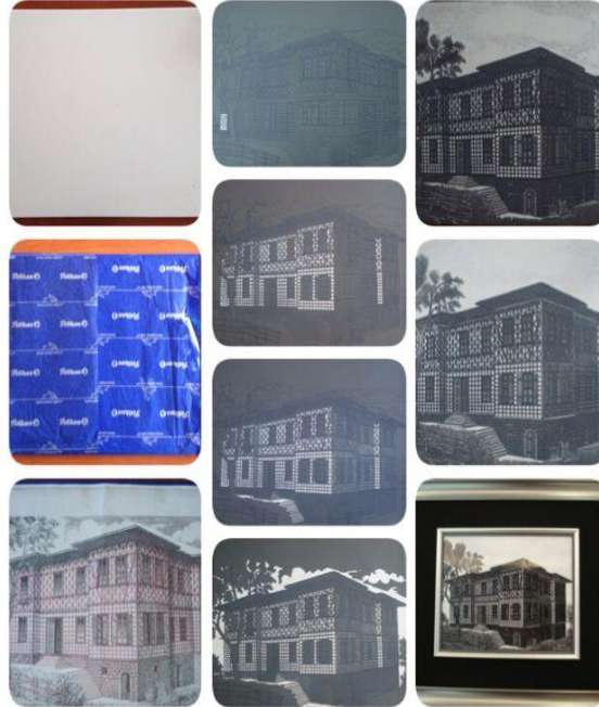
Ek 2: Sol yukarıdan aşağıya karo, karbon kâğıdı kaplanmış karo, desenin ürün üzerine aktarılması, desenin ürün üzerine işlenmiş hali, sgraffito resminin yapım aşamaları, pişirilmiş ve çerçevelemiş hali