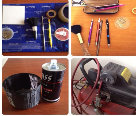
Ek 1: Sgraffito Tekniğinde Kullanılan Malzemeler