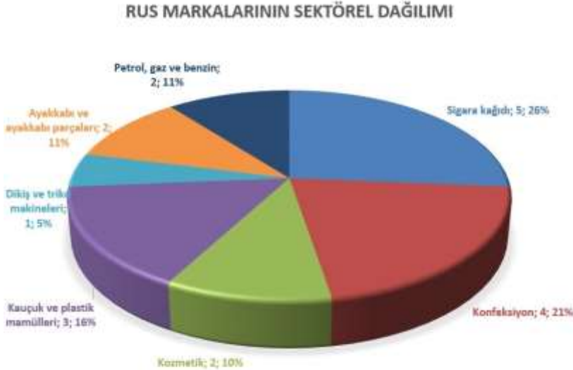
Şekil 1: Tescillerin Ürün Gruplarına Göre Dağılımı

İkinci analiz ise marka tescillerinin yıllara göre dağılımlarıdır. Analize konu olan 19 markanın tescil kayıtları Rumî 1307/1891 tarihinde