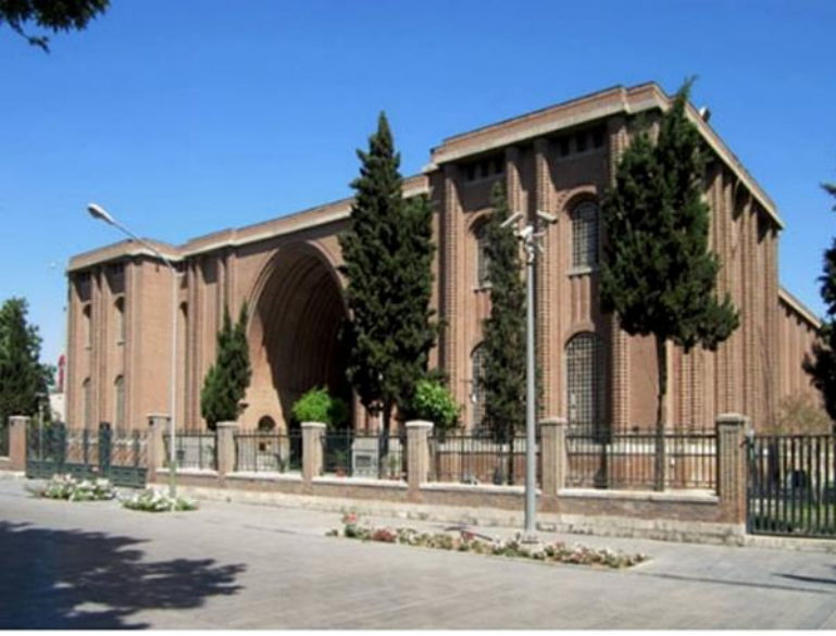
Şekil 5: İran Ulusal Müzesi (Bastan).

Şekil 4: Jacques Demorgan çalışma odasında, 1900 civarında (Amiet, 2010, 16).