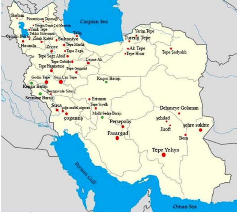
Şekil 1: İran'daki arkeolojik yerleşimleri gösteren harita (Harita, Leila Afshari).