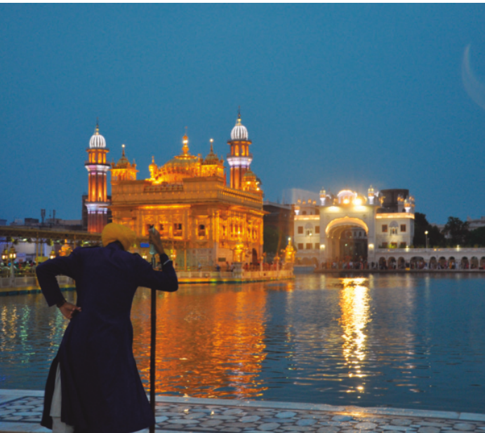
HİNDİSTAN AMRİTSAR ALTIN TAPINAK