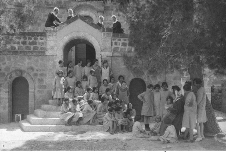
Ek-3: Talitha Kumi Kız Okulu/Yetimhanesi Öğrencileri

Kaynak: https://www.talithakumi.org/en/school-kindergarten/542-2/ (02.06.2019).