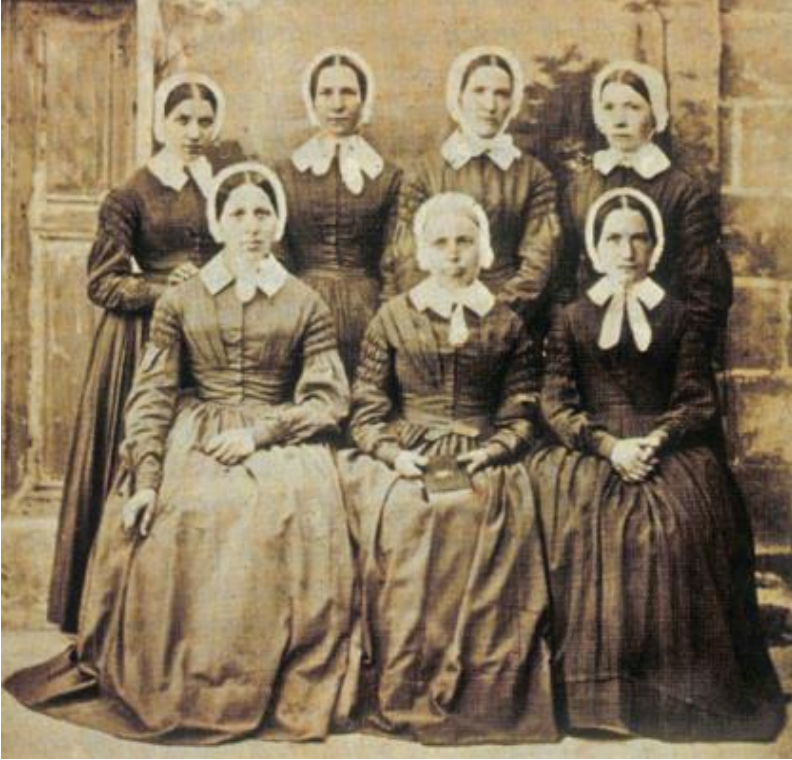
Ek-4: Kudüs'teki Kaiserswerther Diyakonezleri