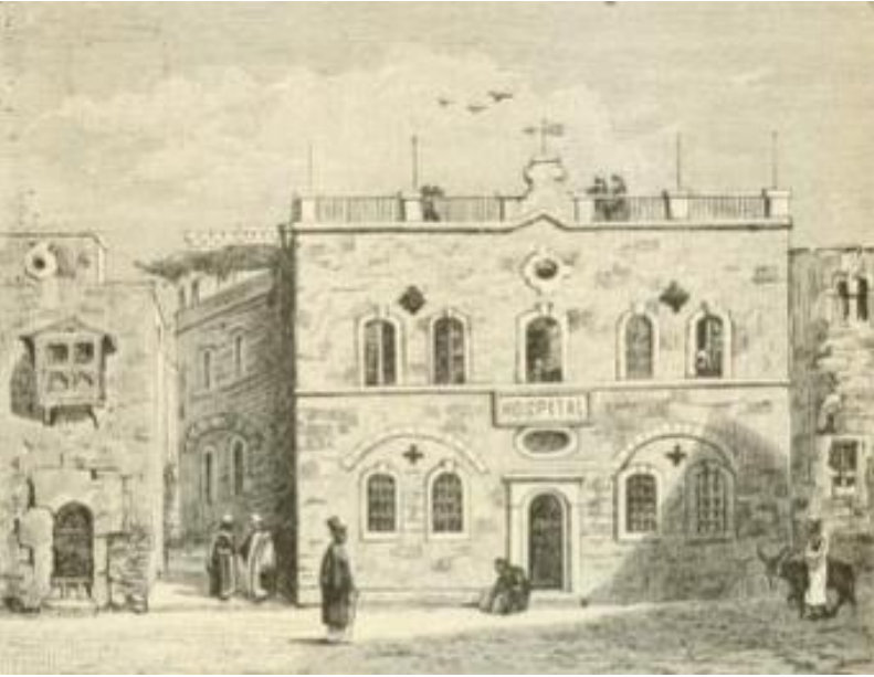
EK-2: Kudüs'teki Kaiserswerther Alman Hastanesi