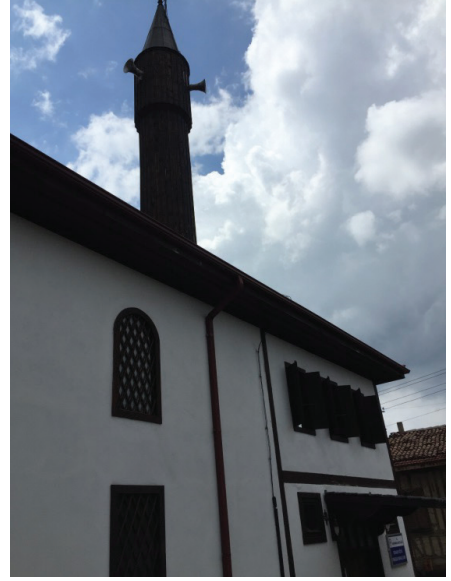
Resim 11-12. Konari Köyü'nde yer alan Ferhatlar Mahalle Camii