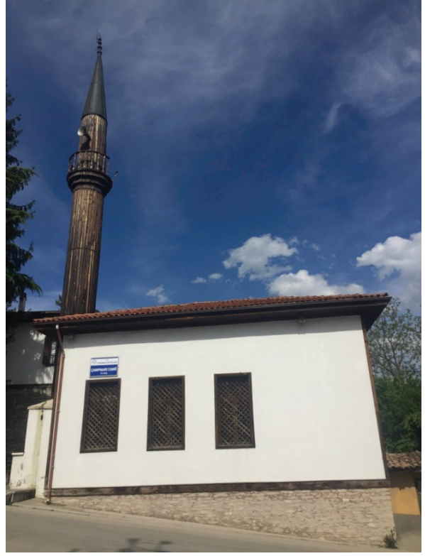
Resim 4-5. Safranbolu'nun Bağlar mevkiinde yer alan Çampınarı Camii