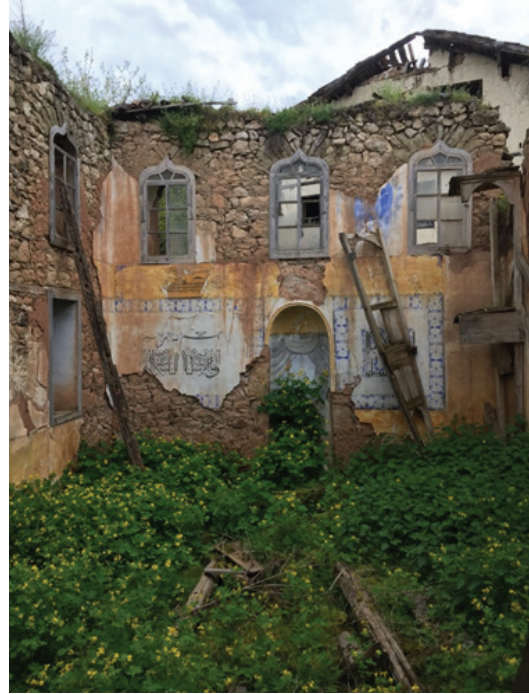
Resim10. Kuzyakaköseler Köyü'ndeki Fezziye Camii