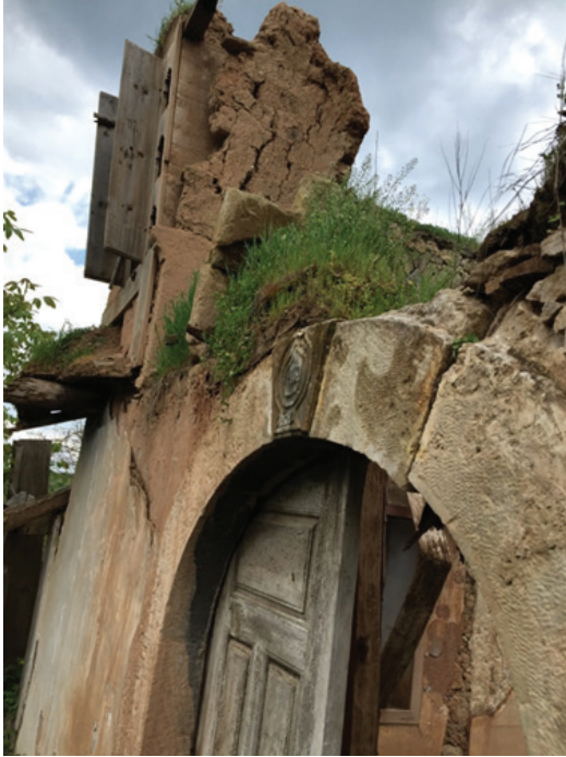
Resim 9. Kuzyakaköseler Köyü'ndeki Fezziye Camii