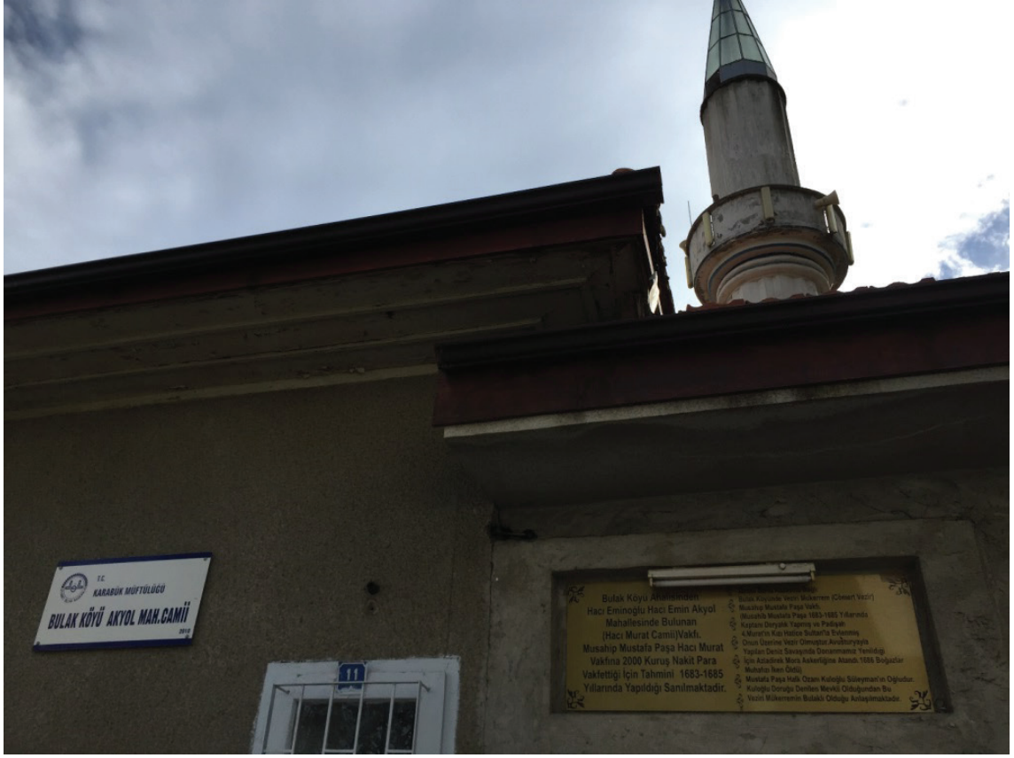
Resim.1 Bulak Köyü Akyol Mahallesi Camii