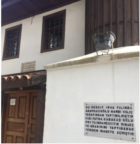
Resim 6. Safranbolu'nun Bağlar mevkiinde yer alan Çampınarı Camii