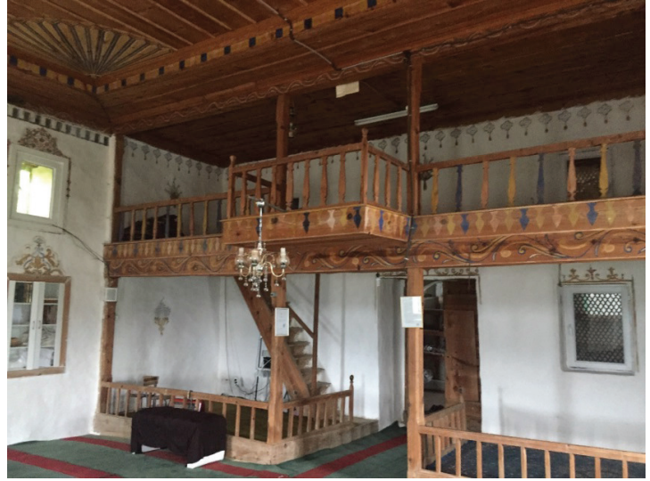
Resim 19. Karaşar Köyü'ndeki Cami'nin İç Mekânı