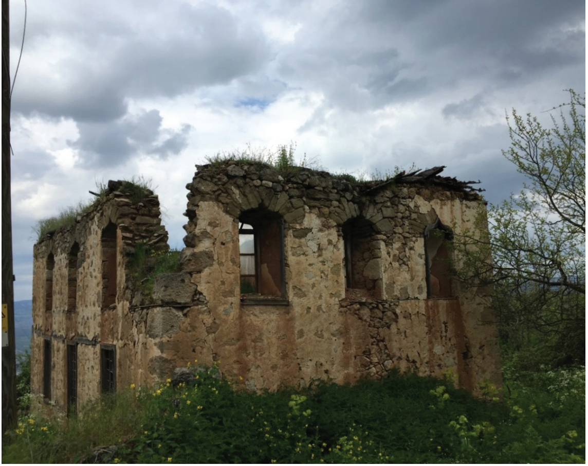
Resim 8. Kuzyakaköseler Köyü'nde kalıntılara rastlanılan metrûk haldeki Fezziye Camii