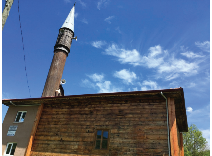
Resim.3 Ovaseyhler Köyü Cami