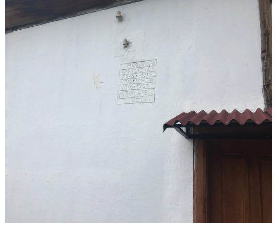
Resim 16-17. Çankırı'nın Çerkeş İlçesine Bağlı Karaşar Köyü'nde Bulunan Cami