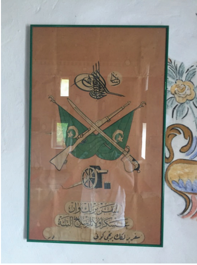
Resim 18. Karaşar Köyü'ndeki Cami'nin içerisinde muhafaza edilen "Seferberlik" günlerine ait bir ilân