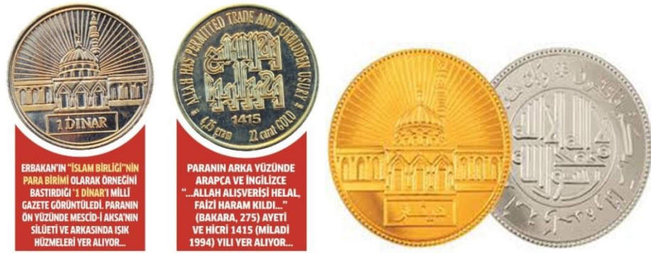
Fotoğraf 1: İslam Ortak Pazarı için Erbakan tarafından yaptırılan ve 1994 yılında TBMM kürsüsünden tanıtılan İslâm dinarının 79 iki versiyonu 80

Erbakan, SSCB'nin dağılmasından sonra "Yeni Bir Dünya" ve onun kurucu ve şekillendirici aşaması olan İslâm birliği idealini daha fazla ön plana çıkarmıştır. Bu dönemde İngiltere Başbakanı Margaret Thatcher'in "Düşmanı olmayan ideoloji yaşayamaz. Bizim yaşayabilmemiz için mutlaka bir düşmanımızın olması lazımdır. Sovyetler Birliği dağıldı ve düşman olmaktan çıktı. Onun yerine yeni bir düşman koymamız gerekiyor. Bu yeni düşman İslam olacaktır", 81 sözlerini de gündeme taşıyan Erbakan, Küresel Sistem'in hesaplarına 82 karşı İslâm birliği fikrini çıkış yolu olarak görmüştür. Bu bağlamda Refah Partisi'nin 1991 ve 1995 seçimleri için hazırlanan seçim beyannamelerinde İslâm birliği ile ilgili hususlar öne çıkarılmıştır. Erbakan, Müslüman ülkeler arasındaki birliğin ve ilişkilerin artırılmasını seçim vaadi olarak halka sunmuştur. 1991 genel seçimleri için hazırlanan seçim beyannamesinde dış politikaya dair vaatlerin bazıları şunlardır: 83