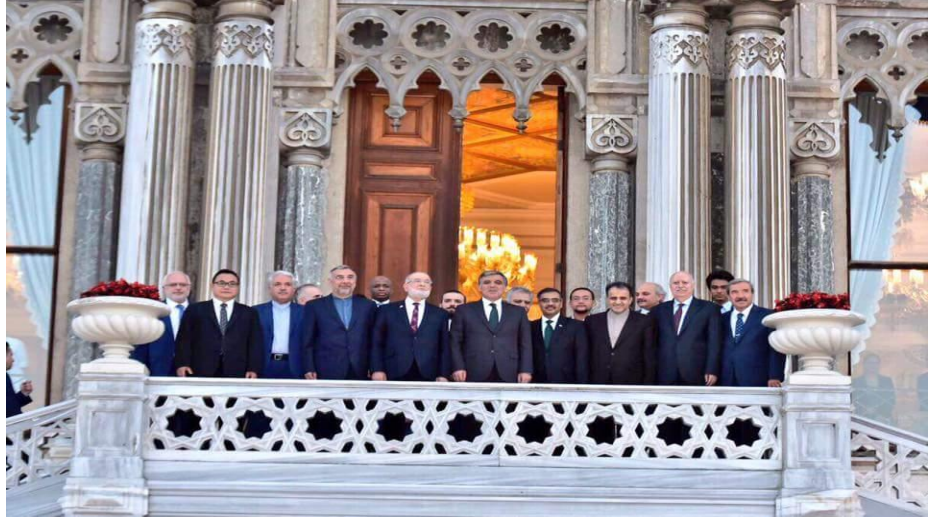
Fotoğraf 3: D-8 22. Kuruluş Yıldönümü Toplantısı, 29 Haziran 2019 Çırağan Sarayı 202

D-8 bünyesinde birçok zirve, konsey ve komisyon toplantısı yapılmıştır. 201 Kuruluşun son toplantısı ise İstanbul’da 5 Temmuz 2019 tarihinde resmi kuruluş yıldönümü kutlaması, bir resepsiyonla Genel Sekreterlik tarafından gerçekleştirilmiştir. 29 Haziran 2019 tarihinde ise Saadet Partisi tarafında Çırağan Sarayı D-8 22. Kuruluş Yıldönümü Toplantısı adıyla ayrı bir toplantı düzenlenmiştir.