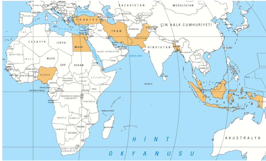
Harita 1: D-8 Ülkeleri 156

Türkiye'nin, bölgesel, kültürel ve tarihi mesuliyetlerinin, Türkiye'yi lider ülke konumuna getirdiğini savunan Erbakan, refah ve kalkınma için bölgesel ve küresel birliklere inanmış, bu inancını da D-8 ile somutlaştırmıştır. 157 Bu çerçevede D-8'ler Türkiye'nin önderliğinde "Yeniden Büyük Türkiye" ve "Yeni Bir Dünya" hedeflerine ulaşmakta bir aşamadır. 158 D-8'ler için nüfusu 60 milyondan fazla olan sekiz ülke tespit edilmesine karşın 159 "grup devlet" mantığıyla genişlemesi, esas olarak benimsenmiştir. 160 Başta Türkiye Cumhuriyetleri olmak üzere gelişmekte olan bütün ülkelerin ve diğer Müslüman ülkelerin, nüfusları ne olursa olsun D-8'lerin doğal üyesi olduğu, Erbakan tarafından deklare edilmiştir. 161 Kuruluşundan hemen sonra ise Hindistan katılma talebini iletmış, Ürdün ise resmen başvuru yapmıştır. Azerbaycan da ilk aşamaya dâhil edilmemekten dolayı rahatsız olmuştur. 162 Ancak genişlemede genel eğilimin D-8'lerin kökleşip derinleşmesinden sonra ele alınacağı belirtilmiştir. 163