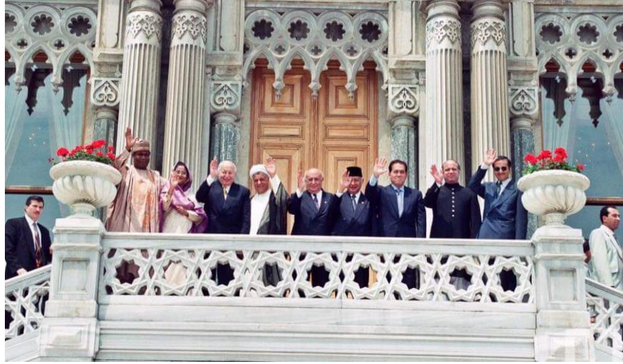
Fotoğraf 2: D-8 Kuruluş Toplantısı, 15 Haziran 1997 Çırağan Sarayı 134

Muslim Eight" (M-8) olarak adlandırılan 131 D-8'in temelleri, Ekim 1996'da dönemin başbakanı Prof. Dr. Necmettin Erbakan'ın daveti ve bu ülkelerin temsilcilerinin katılımıyla İstanbul'da düzenlenen "Kalkınmada İşbirliği Konferansı"nda atılmış olup, 22 Ekim 1996 tarihindeki "Kalkınmada İşbirliği Konferansı"ni izleyen bir dizi hazırlık toplantılarından sonra 15 Haziran 1997 yılında İstanbul'da yapılan devlet ve hükümet başkanlarının katılımıyla gerçekleşen ilk zirvede "İstanbul Deklarasyonu" 132 ile D-8'in kuruluşu resmen ilan edilmiştir. 133