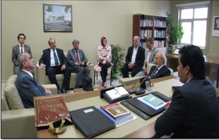
Aksaray'da bulunduğumuz esnada İslam Tarihi Anabilim Dalı hocalarımızın ziyareti.