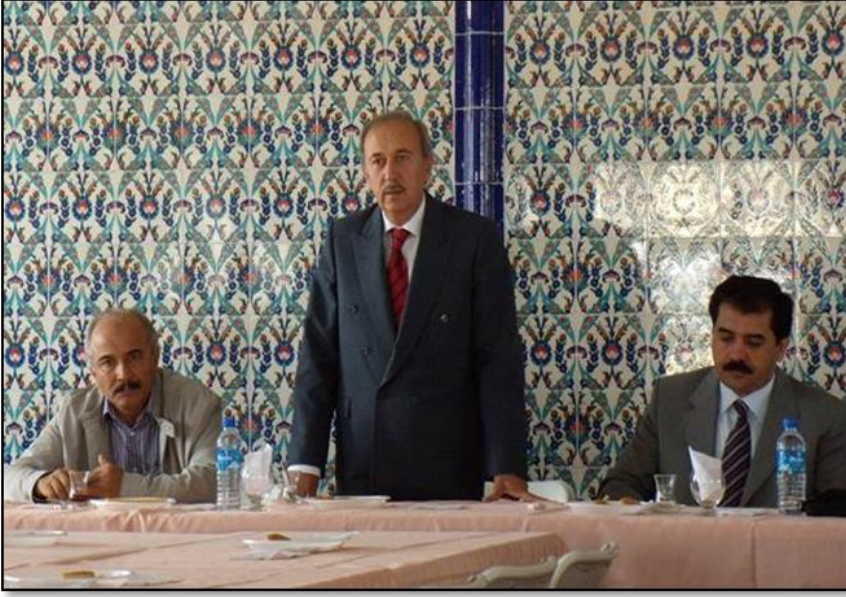
Dekan Yardımcılığımız döneminde Dekan Hocamızla bir toplantı esnasında.