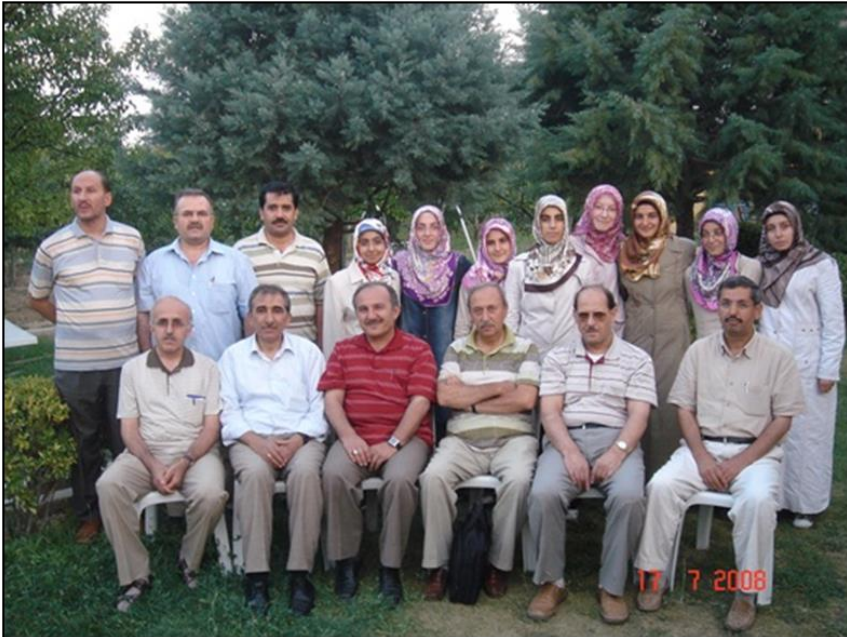
Bilge Programı öğrencileriyle