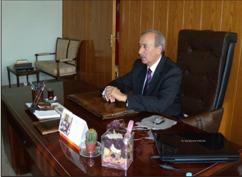
Hocamız dekanlık makamında