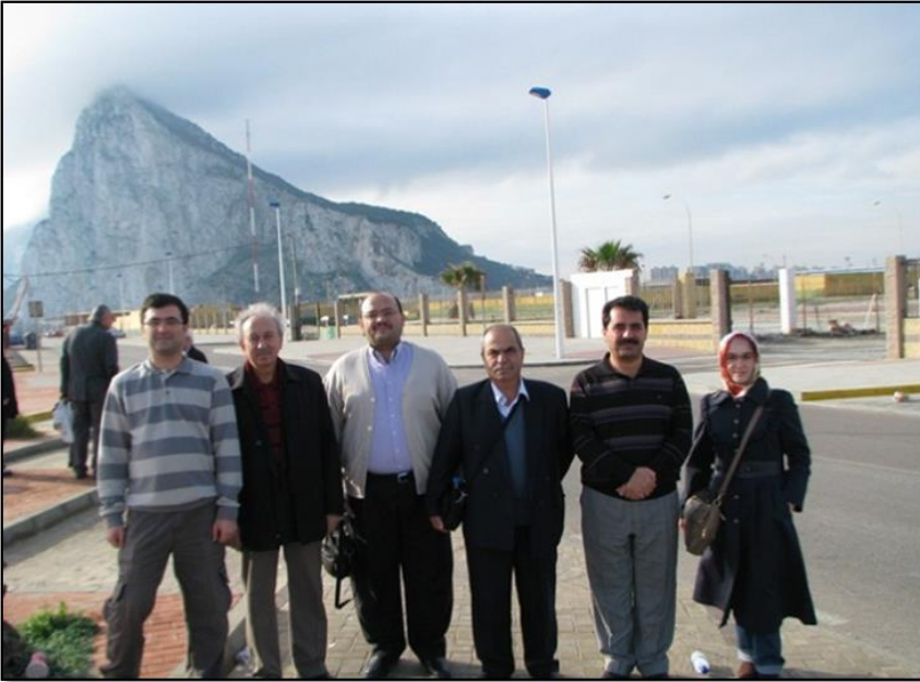
İslam Tarihi Anabilim Dalı elemanları Endülüs gezisinde.