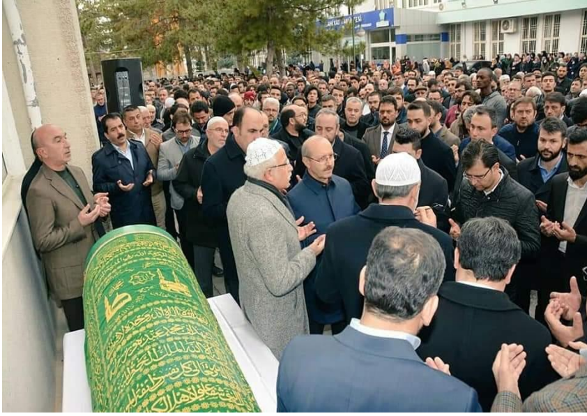
Hocamız son yolculuđuna uđurlanırken.