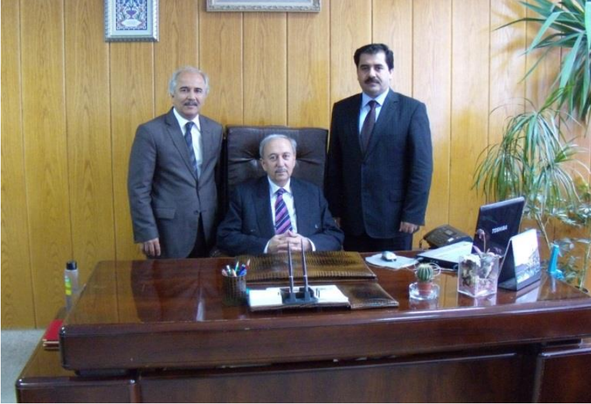
Dekanlık Makamında (21 Mart 2011)