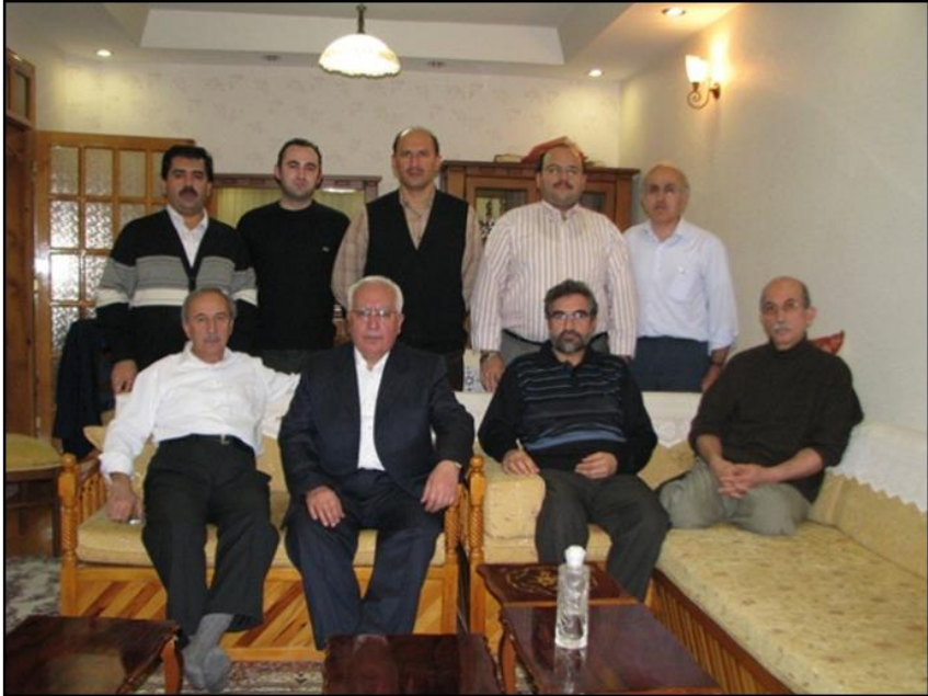
Konya İlahiyat Derneğinin bir dönem yönetim kurulu üyeleri.