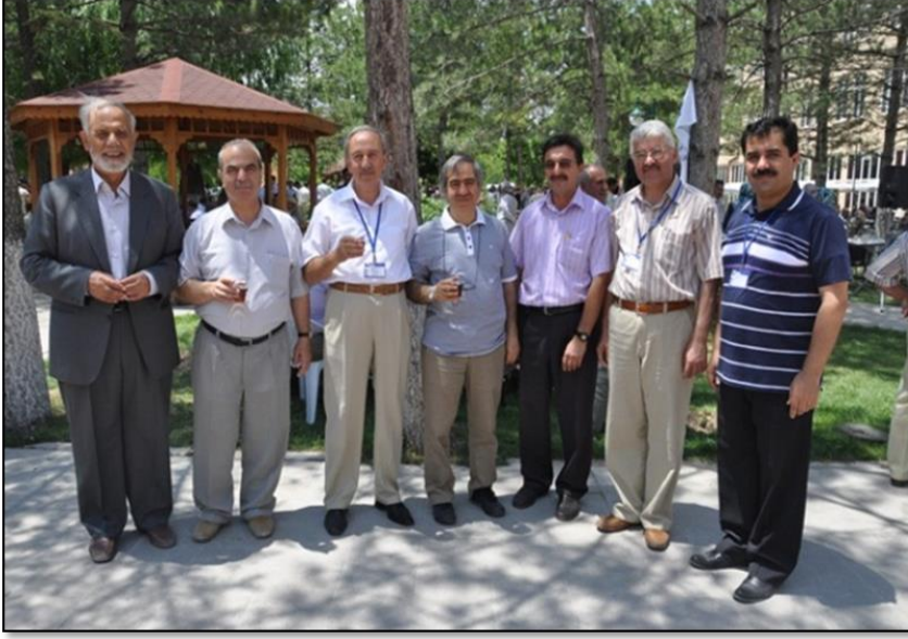
Mezunlar buluşması programından.