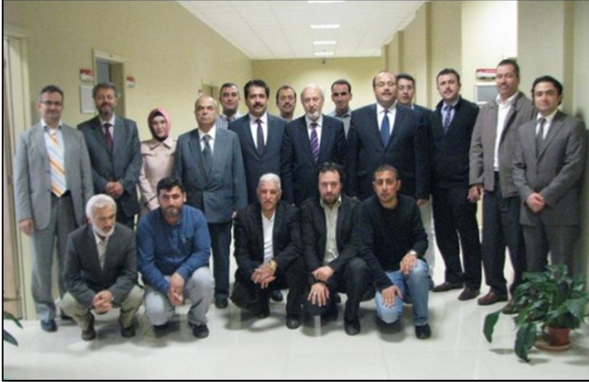
Aksaray'da bulunduğumuz esnada hocalarımızın ziyareti esnasında Aksaray İslami İlimler Fakültesi hocalarımızla.

Ancak benim Aksaray'da olduğum sürede muhterem hocamız rahatsızlanmış, kolon kanseri teşhisiyle ağır tedavi süreci başlamıştı. Bu ani gelişme anabilim dalı hocaları olarak bizlerin moralini bozmuştu. 2019 yılı temmuz ayında yaş haddinden emekli olacağını bildiğimiz hocamızın emeklilik sonrası da bizleri yalnız bırakmaması için tedbirler düşünürken bu haber bizleri derinden etki-