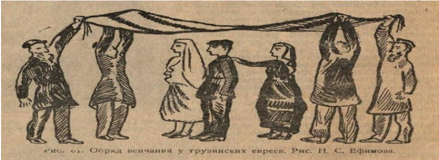
рис. 61. Обряд венчания у грузинских евреев. Рис. Н. С. Ефимова.