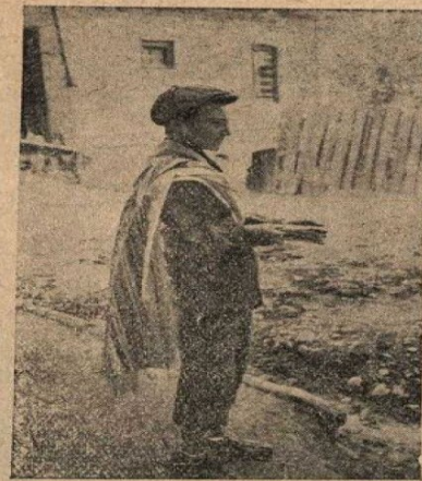
Рис. 70. Грузинские евреи. Возле синагоги. Мальчик, облаченный в талет. (Из матер. ЦМН. Фото автора).