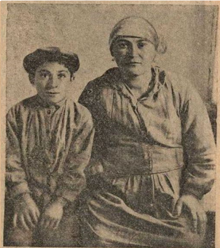
Рис. 73. Грузинская еврейка, родившая 14 детей. Остался в живых один мальчик. На нем ангароза, полученная от муллы. (Из мат. Ц.М.Н. Фото М. Плисецкого).

1. Soldaki Foto: Oni şehrinden bir Gürcü Yahudi