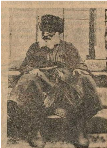
Рис. 80. Грузинский еврей из города Они, один из участников карбан песаха.