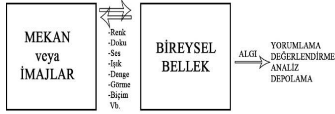
Şekil 1: Mekânın Duyum Aşaması [11].

ilişkilendirilmesi” olarak açıklanmaktadır [10]. Mekânlar belleğin bağlamıdır ve mekânların fiziksel üretimi mimarlık pratiğindedir. Yani mimarlık üretimleri sayesinde bellek süreçlerini tetikleyici işlevi görmektedir (Şekil 1).