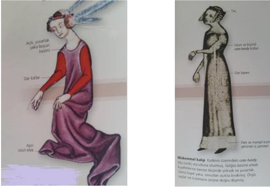
Fotoğraf 3:Erken Gotik Dönem Kadın Giysi Örnekleri(Orsborne,2013:64).

Kumaşa ulaşmak daha kolay bir hal almıştır. Bu durum Fransa'nın etkisiyle, hatlar ve kesim ön plana çıkarılarak yeni bir giyim tarzına doğru geçiş başlamıştır. Feodalizmde rütbe, servet ve unvan gibi olgular önemli iken; ortaya çıkan yeni tüccar sınıfı feodalizmin toplumsal hiyerarşisini değiştirmiştir. Kentler manifaturacı, ayakkabı tamircisi, çorapçı, şapkacı, tuhafiyeci, kadın ve erkek terzisi gibi revaçta olan ticari faaliyetlerin merkezi haline gelmiştir. Dolayısı ile arzulanan giysilere her sınıftan çok sayıda insan için ulaşılabilir bir hal almıştır(Fogg,2014:42). Ancak giysiler kişilerin toplumdaki hiyerarşisini sembolize etmekten geri durmamıştır. Kumaş çeşitleri, süslemeler, başlıklar, kemer, ayakkabı ve kullanılan aksesuarlar sosyal farklılıkları ortaya koymada etkili olmuştur.