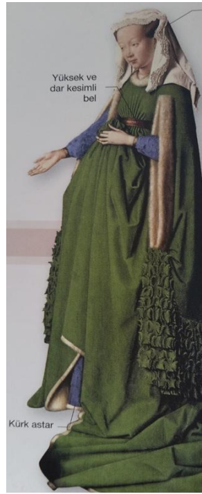
Fotoğraf 5: "Houppeland" Geç Gotik Dönem Kadın Giysisi (Orsborne,2013:74).

Çok amaçlı bir giysi olan Houppelande , 1360 ta ortaya çıkmış tunik, manto, ve harmani gibi diğer kollu dış giyim eşyalarının yerini almıştır. Kadınlar bu giysinin önü kapalı , yere kadar uzanan ve genelde arkada kuyruğu olan modelini giymişlerdir. Kumaş katları göğüs altında yüksek bel hizasında toplanıyor ve elbisenin kolları oldukça geniş kesimliydi. Hem etek ucu hem kol uçları kontrast renklerde tırtıklı, fistolu ya da aplikeliydi. Kumaş o kadar müsrifçe kullanılıyordu ki ahlakçılar bu tarzı yerden yere vuruyorlardı. 15. yy'ın ilk yarısında Houppelande "entari ya da "cübbe" yüzünden gözden düştü ve kesimdeki aşırılıklar törpülenmiş, süslemeler doku ve desen üzerindeki oynamalarla sınırlandı(Fogg,2014:47).