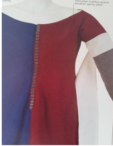
Fotoğraf 6:«cote-hardie» Repröduksiyon örneği (Orsborne,2013:62).

kadar genişlemiştir ki ekstra kumaş göğüs hizasının altındaki bir kemerle tutturulmaya başladı(Fogg,,2014:45). Dar kesimli kollar ellerin üzerine kadar inmiştir. Dar kol üzerine kol atkısı diye tabir edilen «cote-hardie» kullanılıyordu.