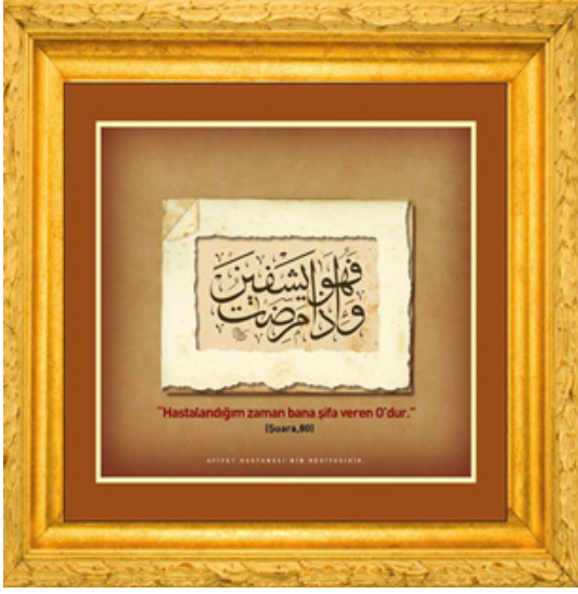
Fig. 8: Şuarâ 80. ayetin Sülüs tarzda istiflenmiş bir levhası fotoğrafı, 2019 (Dr.Mahmut Tokaç'ın özel koleksiyonu)