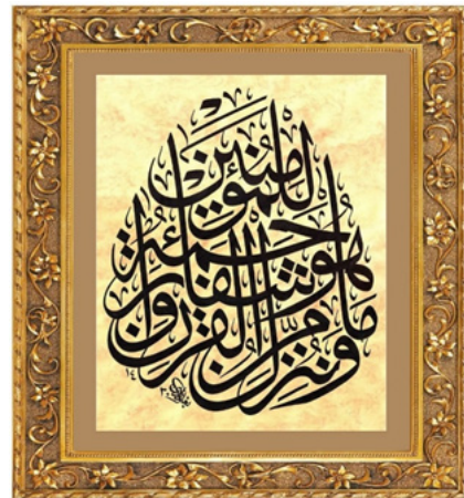
Fig. 7: Şifâ ayetlerinden kabul edilen İsra suresinin 82. ayetinin Abbas el-Bağdadî tarafından çok güzel istiflenmiş Sülûs tarzda bir levhasının fotoğrafı, 2019 (Dr.Mahmut Tokaç'ın özel koleksiyonu)