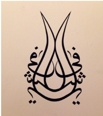
Fig. 4: Yeni dönem sağlık kuruluşlarımızdan Medipol Mega Hastanesinin Mescidinde lale şeklinde çift yönlü istiflenmiş güzel bir “Yâ Şâfi” yazısının fotoğrafı, 2019