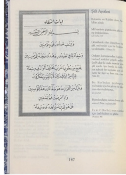
Fig. 5: Bir Dua Kitabında “Şifâ âyetleri” sayfası