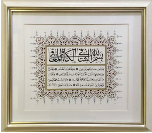
Fig. 9: Şifa ayetlerini bir arada bulunduran Ali Hüsrevoğlu'na ait bir hat levhası fotoğrafı, 2019 (Dr.Mahmut Tokaç'ın özel koleksiyonu)