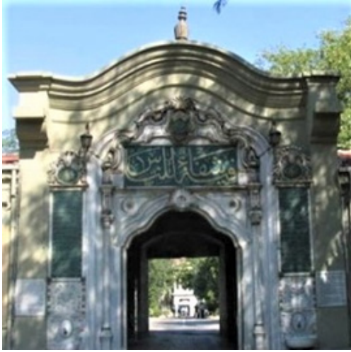
Fig. 3: “Fihî şifâun li'n-nas” farklı bir şekilde yazıldığı eski Maltepe Askeri Hastanesi giriş kapısındaki Celî Sülûs hat levhasının fotoğrafı, 2019