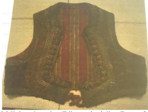
Fotoğraf:8 Kolsuz Camadan (Edirne Arkeoloji ve Etnografya Müzesi)

Fermene: Çuha ve aba kumaşından yapılıp kolsuzdur. Şekil yönünden camadana benzer fakat ondan biraz daha uzun olup yelek şeklindedir. Fermenenin üzeri çiçek motifleri ile süslenmiştir. Süslemelerde bükme, ipek siyah ibrişim iplikleri kullanılmıştır. Fermene giyenler üzerine salto giymezler (www.forum-alev.net,2018).