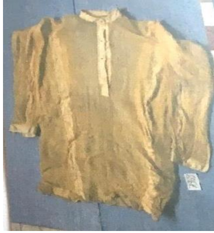
Fotoğraf:4 Mintan (Gömlek) (Edirne Arkeoloji ve Etnografya Müzesi)

Mintan: Bugünkü adıyla gömlektir. Pamuklu dokumadan yapılıp genellikle beyaz renkten olur. Beyaz renk dışında köylü kumaşı denilen gri çizgili bir kumaştan yapılanlar da vardır. Bununla birlikte bazen zemini beyaz üzeri mavi ve kırmızı çizgili kumaştan da dikilirdi(www.forum-alev).