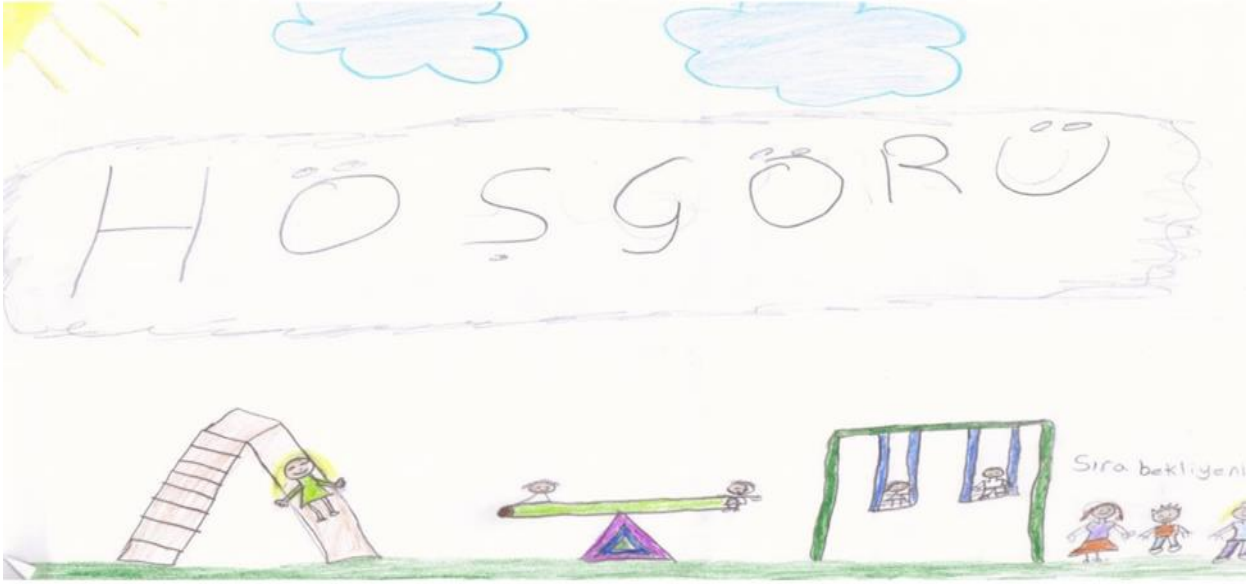
Resim 7. Gül'ün Resmi

Öğrencilere çizdirilen resimler ve yapılan görüşmeler sonunda, öğrencilerin çoğunluğunun hoşgörüyü yardım etmek ve saygı duymak olarak algıladığı ortaya çıkmıştır. Çok az sayıda öğrenci hoşgörüyü paylaşmak , affetmek , iyilik yapmak ve farklılıklara saygı ile kabullenme olarak açıklamıştır. Bu çalışmada dördüncü sınıf öğrencilerin hoşgörüyü yanlış ve eksik anladıkları, hoşgörünün tanımının ne olduğunu tam olarak bilmedikleri ortaya konmuştur. Ayrıca çevrelerinde yaşadıkları olayların hangilerinin hoşgörü bağlamında değerlendirileceğini, hangi davranışların hoşgörü ile karşılanamayacağına ilişkin sınırlı ifadeler kullandıkları görülmüştür. Dört öğrenci hoşgörüyü “Mevlana” ile ilişkilendirmiştir. Bunun araştırmanın yapıldığı dönemde “Şeb-i Aruz” törenlerinin yapılması ve öğrencilerin yaşadığı çevrede reklam panolarında Mevlana afişlerinin olmasından kaynakladığı düşünülmektedir. Öğrenciler kişisel olarak kendilerine karşı yapılan olumsuz davranışları hoş görebileceklerini belirtirlerken; kendilerine karşı kasıtlı yapılan olumsuz davranışları hoş göremeyeceklerini belirtmektedirler. Ayrıca yaşlılara, engellilere, arkadaşlarına ve savunmasız hayvanlara karşı yapılan olumsuz davranışları da hoş göremeyeceklerini söylemişlerdir. Öğrenciler genellikle öğretmenlerinin, anne, baba ve arkadaşlarının hoşgörülü olduğunu, bunun yanında dedelerinin, anneanne ve babaannelerinin de hoşgörülü olduklarını belirtmişlerdir.