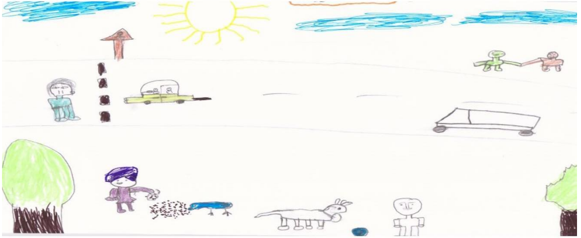
Resim 2. Rahim'in Resmi

Hoşgörüü çevresinde bulunan insanlara saygılı davranmak olarak tanımlayan Betül “Hoşgörü deyince insanlara saygılı olmak onlara saygılı davranmak onların haklarını çiğnememek onların haklarına karşı gelmemek” olarak açıklamıştır. Betül sınırsız özgürlüğümüzün olmadığını söyleyerek özellikle yaşlılara ve hastalara karşı saygılı davranmamız gerektiğini ifade etmiştir. Betül’ün hoşgörüü insan hakları bağlamında açıkladığı söylenebilir. Ayrıca kendi adıyla dalga geçen arkadaşlarını ve apartmanda sebep yokken kendisine vurarak kaçan arkadaşlarını hoşgörü ile karşılayamayacağını belirten Betül “Bizim apartmanda bazen soba yakıyorlar. Soba kokuyor, apartmanın içinde evlere dağılıyor. Kömür kokuyor çok kötü oluyor ama sonra onları uyarınca hemen içeri alıyorlar. Biz de onları hoşgörü ile karşılıyorz” şeklindeki açıklamasıyla neleri hoşgörü ile karşılayıp karşılayamayacağını belirtmiştir. Çevresinde öğretmeninin ve Berna adında bir arkadaşının hoşgörülü olduğunu ve onlardan hoşgörülü olmayı öğrendiğini söyleyen Betül; “Oyunlarda sürekli böyle hiç haksızlık yapmıyor. Hiçbir şeye itiraz etmiyor oyunun kurallarını açık açık belirtiyor yanlışlarımızı uyararak söylüyor. Bizi kırmıyor ve hep onunla oynamak istiyoruz.” diyerek Berna’nın nasıl hoşgörülü davrandığını açıklamaktadır. Resminde ( Resim 3 ) komşularını yüksek sesle müzik dinleyerek rahatsız eden insanları çizdiğini söyleyen Betül resmiyle ilgili görüşlerini şu şekilde açıklamıştır: