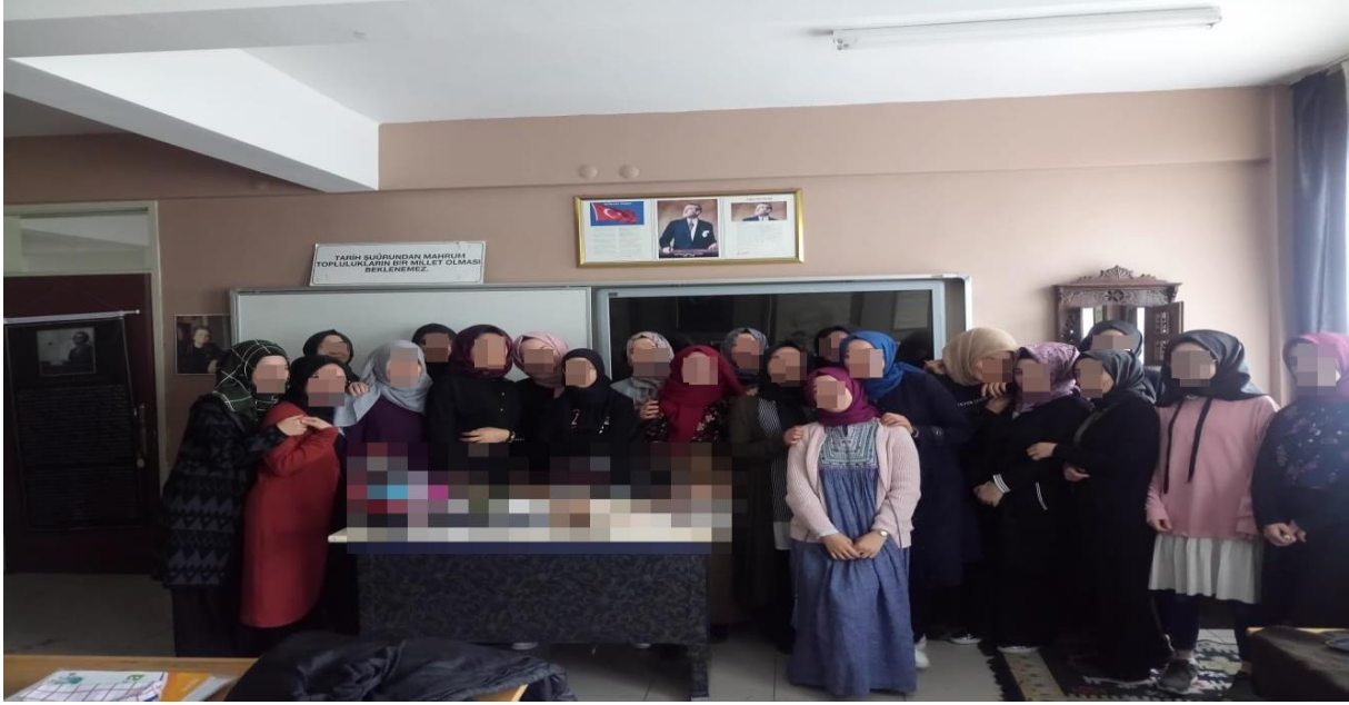
Etkinlik sonu öğrenciler ile fotoğraf

Bu posterleri oluştururken eğlendiklerini belirtmişlerdir. Çalışma Yaprağı-2/ Ekler kâğıdında yer alan görsellerden faydalanan öğrenciler şuna kadar adını duyup fotoğraflarını hiç görmedikleri kişileri de bu ekler sayfasından yararlanarak öğrenme fırsatı bulduklarını ifade etmişlerdir.