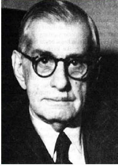
Prof. Dr. Adnan Adıvar