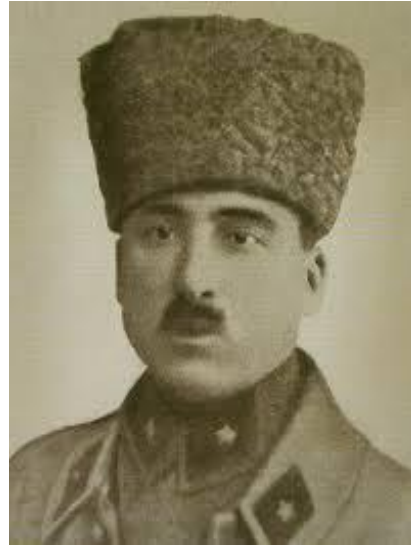
Kemaleddin Sami Gökçen