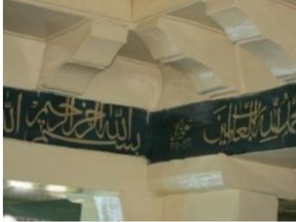
Fotoğraf No 2: Orta Tavan Kirişlerindeki Tamir Yazısı (VBM Arşivi)

Caminin 1952 yılında Ayaz Paşa Caddesi yapılırken yol kotunun aşağıya alındığı bu dönemde merdivenlerin yapıldığı, üst pencerelerin değiştiği, son cemaat kısmının açık ve ahşap olduğu sözlü olarak belirtilmiştir (aktaran Erzurum Vakıflar Bölge Müdürlüğü Arşivi, Kasım, 2018). Cami 1977 yılında bir onarım geçirmiştir. Bu dönemde üst örtü yenilenmiş olmalıdır. Orta tavanda bulunan kalem işi hat sırası arasında eski yazı ile tamir tarihi 1977 ibaresi bulunmaktadır. Bu dönemde çatı Marsilya kiremit ile kaplanmıştır (VBM Arşivi)