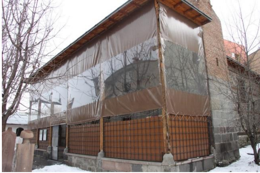
Fotoğraf No 28: Rest. Sonra Açılan Son Cemaat Yeri