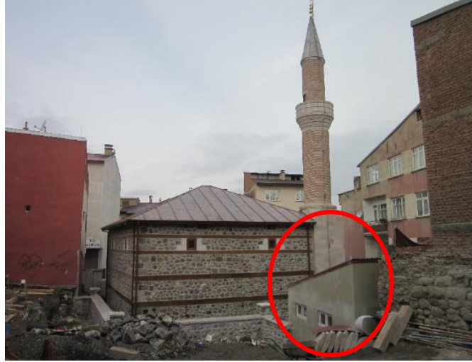
Fotoğraf No 16: Rest. Sonra Doğu Cepheye Alınan Lavabolar (VBM Arşivi)