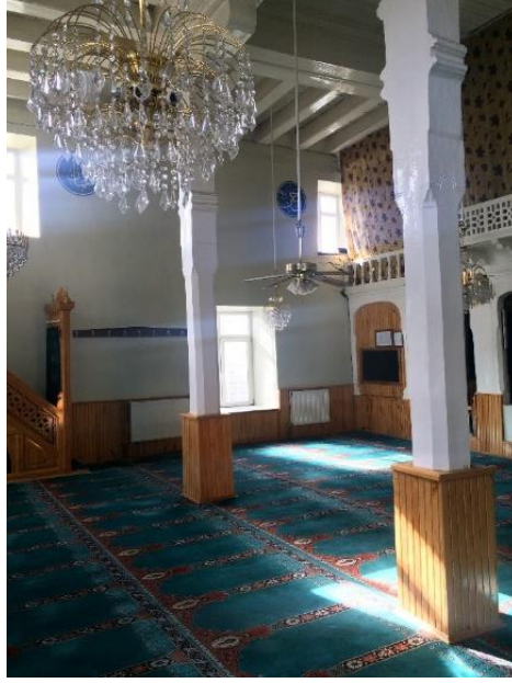
Fotoğraf No 24: Rest. Önce Harim Duvarları, Ahşap Kirişler ve Tavan