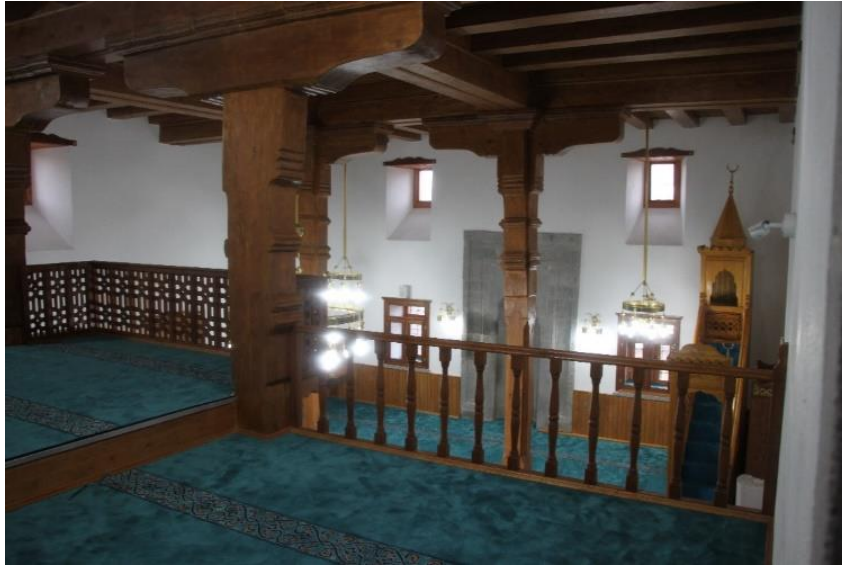
Fotoğraf No 25: Rest. Sonra Yenilenen Duvarlar, Ahşap Kirişler ve Tavan(Ş. Özsağlıcak)