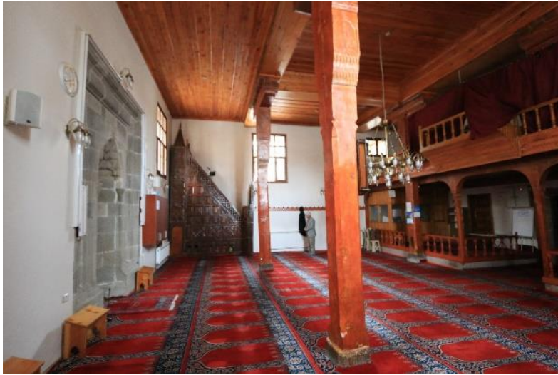
Fotoğraf No 30: Rest. Sonra Yenilenen Harimi Taşıyan Ahşap Direkler (Ş. Özsağlıcak)