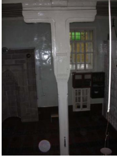
Fotoğraf No 29: Rest. Önce Yağlı Boyalı Olan Harim Ahşap Direkleri