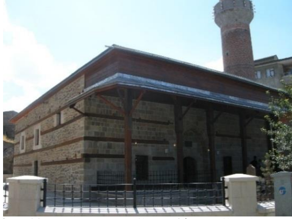
Fotoğraf No 11: Rest. Sonra Yenilenen Ahşap Dikmeler