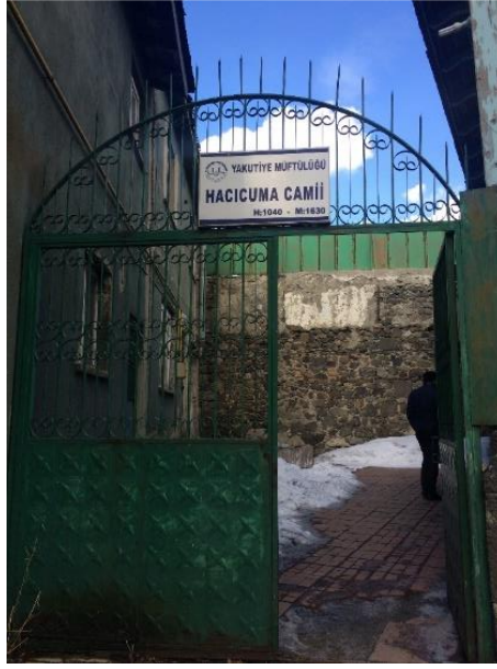
Fotoğraf No 22: Rest. Önce Cami Avlu İçerisinde Bulunan Ek Yapı ve Bahçe Kapısı (VBM Arşivi)

önündeki yapı sökülerek avluya katılmıştır. Yapı çevresine projesine uygun nem yalıtımı ve drenaj uygulanmıştır. İstinat duvarı yenilenmiştir. Harim ve kadınlar mahfilinin duvarlarında horasan sıva + badana, zemininde ahşap döşeme, tavanında çıtalı ahşap malzeme kullanılmıştır (VBM Arşivi).