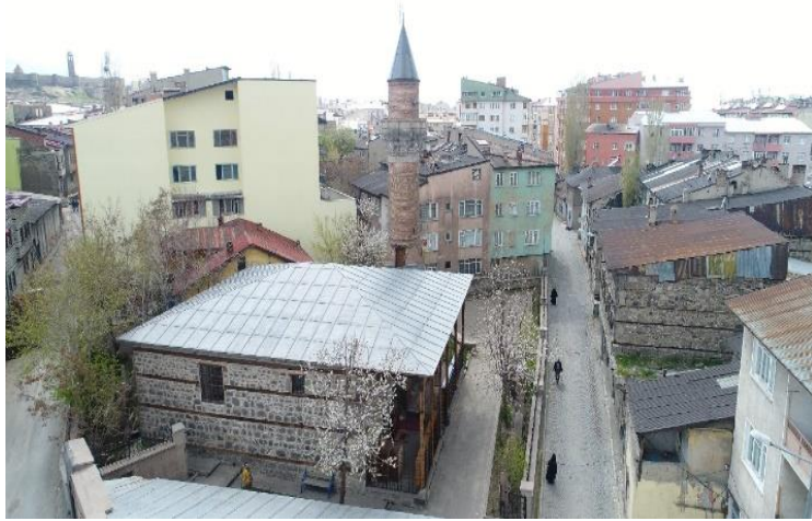
Fotoğraf No 32: Rest. Sonra Bakırla Kaplanmış Olan Çatı