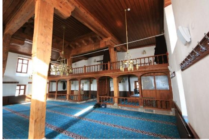
Fotoğraf No 6: Rest. Sonra Yenilenen Harim