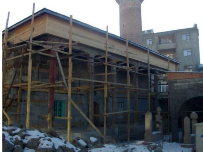
Fotoğraf No 10: Rest. Sırasında Yapılan Son Cemaat Yeri Ahşap Dikmeleri