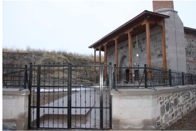
Fotoğraf No 23: Rest. Sonra Kaldırılan Ek Yapının Alanı ve Bahçe Kapısı (Ş. Özsağlıcak)