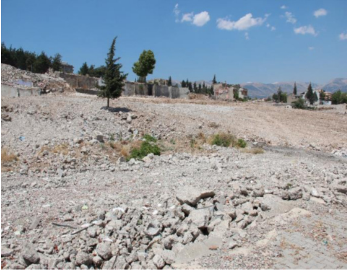
Şekil 4: Uygulamadan önce çalışma alanı

Çalışma alanı, kentsel dönüşümden sonra yapılaşmaya açılmayan ve ilk kez yeşil alan sınıfında düzenlemeler yapılan alan özelliği taşımaktadır. Alanda gecekondular yapılaşması nedeniyle kentsel dönüşüme uğramış ve yıkılmış evler mevcuttur. Alanın uygulamadan önceki mevcut hali Şekil 4’de verilmiştir. Proje alanı kısmen taşlık olsa da yumuşak toprak yapıya sahip oluşu makine ile uygulama kolaylığı sağlamaktadır.