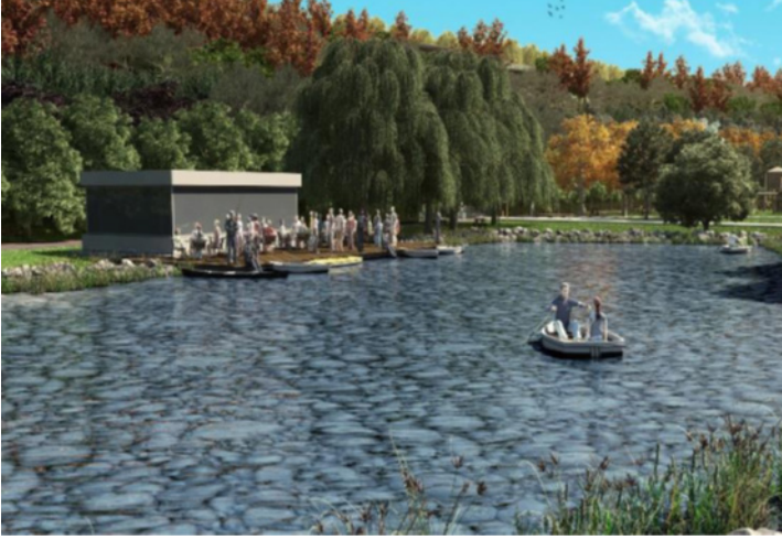
Şekil 6: Biyolojik gölet 3 boyut görsel

Kendi içlerinde ekosistem sayesinde kendi kendini temizleyen ve kendine yeten bir dinamiğe sahip olan biyolojik göletlerin bakım maliyetleri de asgari oranlardadır. Bu nedenlerle millet bahçelerinde suyun bu şekilde bir döngü içinde kullanımı yaygın hale gelmektedir. Ayrıca suyun akar halde kullanımına en iyi örneklerden olan şelalelere de bu projede yer verilmiştir. Görünüleriyle oldukça etkileyici, natürel ve odak noktası oluşturan bir estetik olarak ortaya çıkan şelaleler, sürekli akan suyun şırlıtısıyla da huzuru en üst seviyeye çıkarırlar. Sıcak iklimlerde klima etkisi yaratarak serinlik hissi de uyandırmaktadırlar. Şelaleden akan suyun da biyolojik göletin su rezervine dahil olması ve iki kullanımın da bütüncül olarak çalışması hedeflenmektedir (Şekil 7).