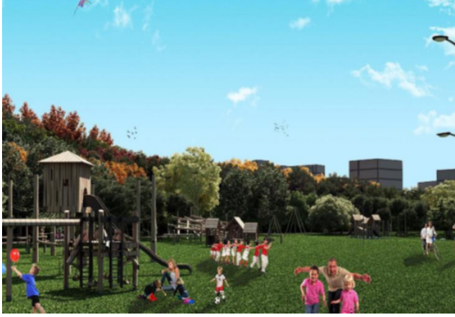
Şekil 8: Çocuk oyun alanı 3 boyut görsel

Genellikle parklarda kataloglardan seçilerek kurgulanan çocuk oyun guruplarından kurulu bir çocuk oyun alanı yerine millet bahçesi kavramına uygun birçok unsuru ile doğal alan oluşturmayı hedefleyen projede oyun guruplarının da doğal malzemeden ve farklı becerileri geliştirici nitelikte olması planlanmıştır. Yeşil veya kum vb doğal alanlar üzerine inşa edilmesi düşünülen oyun gurupları ahşap ve metal ağırlıklı malzemeden, koşma, atlama ve tırmanma gibi basit ve ana oyunları hedefleyen şekilde tasarlanmıştır. Standart oyun alanlarından daha büyük bir alana kurgulanmış bir mekan olması düşünülmüştür (Şekil 8).