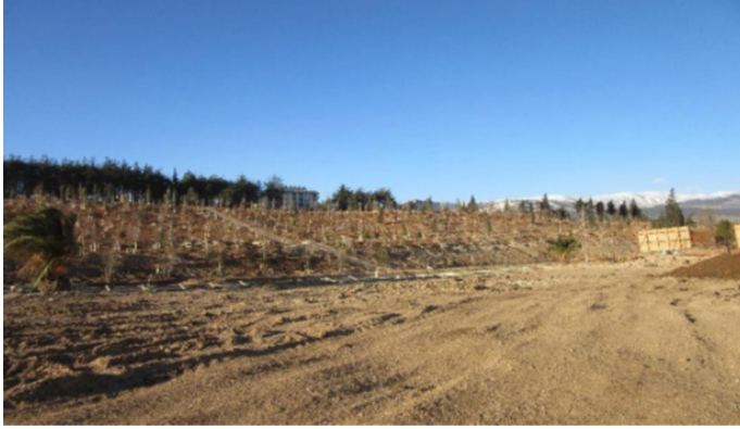
Şekil 5: Ağaçlandırma çalışmaları

Millet bahçesi içerisinde biyolojik gölet, yürüyüş yollar, oturma birimleri, çocuk oyun alanları, spor alanları ile kafeterya ve seyir terası planlanmıştır.