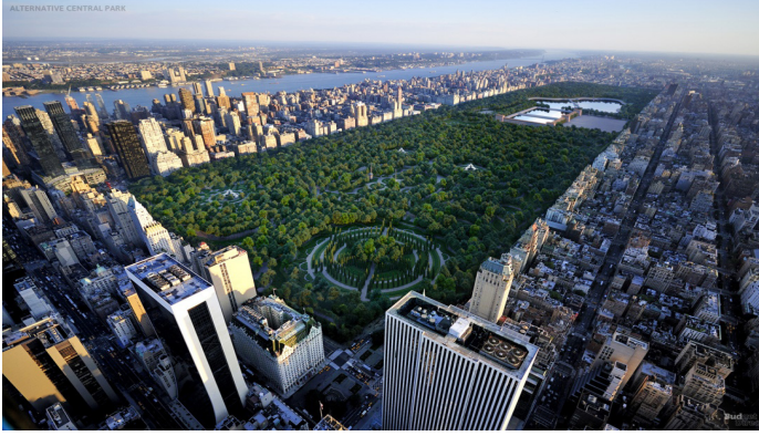
Şekil 1: Central Park-ABD

karılmıştır. 500.000'den fazla ağacın ve fundalığın dikildiği parkta, Manhattan kayalıklarının da görülebildiği göller ve çayırıklar bulunmaktadır. Parkta; tenis kortu, basketbol ve paten sahaları ve satrançtan kritere kadar her türlü spor için ayrılmış alanlar mevcuttur. Geniş bir alanda 161 tür bitkinin (dünyanın her ülkesinden bir tane) ekili olduğu kayın ve fındık ağaçları, güller ve çiçekler bulunmaktadır. Park kendi içinde Wollman Rink, Wildlife Center, Bethesda Fountain and Terrace, Dairy, Bow Bridge, Conservatory Water, Ramble, Belvedere Castle, Delacorte Theater gibi alanlara ayrılmaktadır. 2