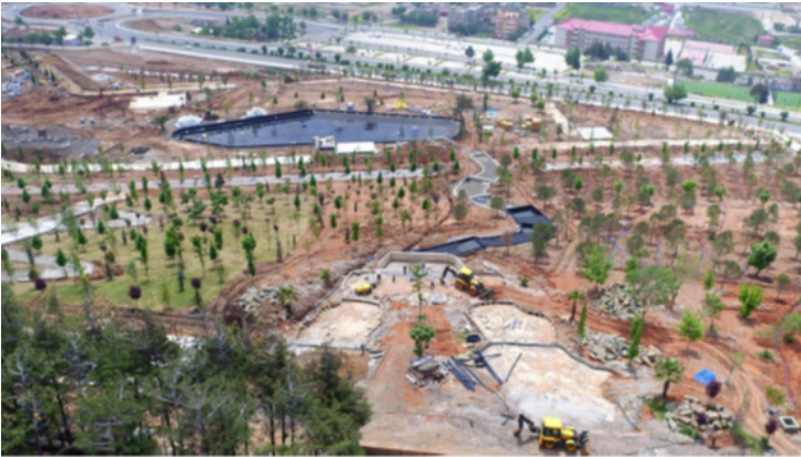
Şekil 7: Şelale ve biyolojik gölet uygulaması

Kendi içlerinde ekosistem sayesinde kendi kendini temizleyen ve kendine yeten bir dinamiğe sahip olan biyolojik göletlerin bakım maliyetleri de asgari oranlardadır. Bu nedenlerle millet bahçelerinde suyun bu şekilde bir döngü içinde kullanımı yaygın hale gelmektedir. Ayrıca suyun akar halde kullanımına en iyi örneklerden olan şelalelere de bu projede yer verilmiştir. Görünüleriyle oldukça etkileyici, natürel ve odak noktası oluşturan bir estetik olarak ortaya çıkan şelaleler, sürekli akan suyun şırlıtısıyla da huzuru en üst seviyeye çıkarırlar. Sıcak iklimlerde klima etkisi yaratarak serinlik hissi de uyandırmaktadırlar. Şelaleden akan suyun da biyolojik göletin su rezervine dahil olması ve iki kullanımın da bütüncül olarak çalışması hedeflenmektedir (Şekil 7).