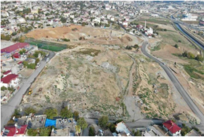
Şekil 3: Proje alanı

Kahramanmaraş ili sınırları içerisinde konumlanan ve 180.000 m 2 olan çalışma alanı, dik ve eğimli bir yamaçtır (Şekil 3). Her iki kesimden tali yollarla kesilen alan engebeli yapısı ile zorlu bir çalışma alanı olmakla birlikte bütüncül bir tasarımı destekleyecek özellikte büyüklüğe de sahiptir. Alanda mevcutta su ögesi bulunmazken, yer altı su kaynağı potansiyeli su kullanımı noktasında destekleyici bir faktör olarak karşımıza çıkmaktadır. Anayola olan yakınlığı ve otopark için rezerv alanlara da sahip olması alanın kullanılabilirliğini arttırmaktadır.