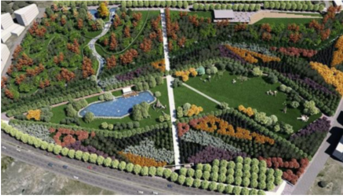
Şekil 10: 15 Temmuz Millet Bahçesi 3 boyut görsel

Proje alanı tasarım kriterleri esas alınarak yapısal ve bitkisel elemanlar ile birlikte düşünülmüş, gerekli ön çalışmalar yapılmış ve projelendirilerek uygulamaya koyulmuştur (Şekil 10).