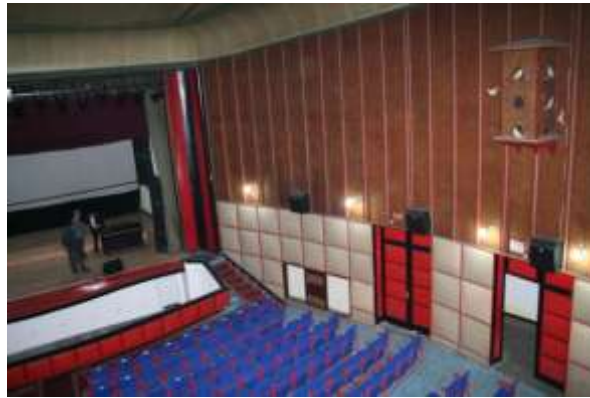
Şekil 6. Yenişehir Sineması İç Mekan