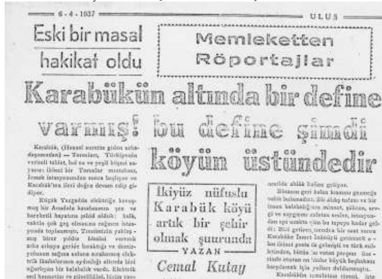
Şekil.3. Ulus Gazetesi, 1937.