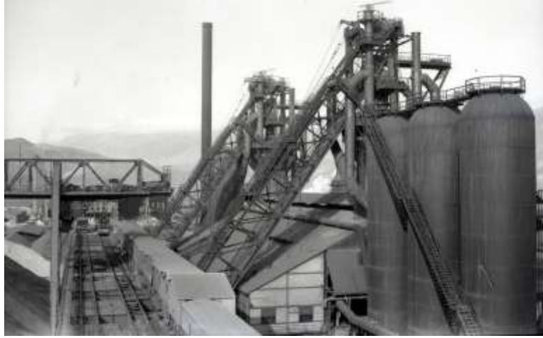
Şekil.2. Demir Çelik Fabrikaları, Karabük