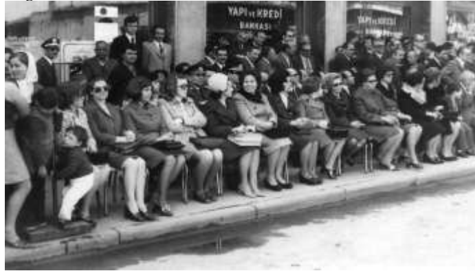
Şekil 9. Milli Bayram kutlamalarında Yenişehir sakinleri

Yenişehir Sineması daha önce belirtildiği üzere konum itibariyle adeta Yenişehir yerleşkesinin göbeğinde yer alır. Günümüze kadar gelen az sayıdaki eğlence odaklı sosyal donatı uygulamalarından bir tanesi olan Yenişehir Sineması'nın gelecekteki akıbeti yerel yöneticilerin Yenişehir Yerleşkesi ile ilgili atacakları somut adımlarla birlikte şekillenecektir. Son dönemlerde Fabrika çevresinde yer alan ve sözde kötü görüntüleri bahane edilerek yıkımı gerçekleştirilen kimi konut alanları sonraki adımın Yenişehir'i kapsayıp kapsamayacağı sorunsalını akıllara getirmekte, bu bölgeyle ilgili mimarlık ve şehircilik tarihi odaklı endişeleri arttırmaktadır.