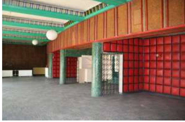
Şekil 7. Yenişehir Sineması İç Mekan Kaynak: Yazar tarafından çekilmiştir