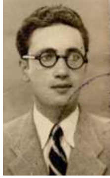
Şekil 4. Yüksek Mimar Münici Tangör

bahçeli evlerin yer aldığı bir yerleşkenin odak noktasında inşa edilmesi itibariyle Yenişehir toplumunun sosyal hayatının şekillendiği bir donatı kimliğindedir. Projenin mimarı Güzel Sanatlar Akademisi'nden 1934 yılında mezun olan Münici Tangör'dür. Erken Cumhuriyet Dönemi'nin mimarlarından olan yüksek mimar Münici Tangör, Karabük'te 1953'ten 1963'e kadar modern bir kent yaratma çabalarına önemli katkılarda bulunur 12 .