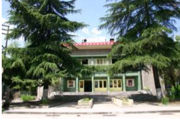
Şekil 5. Yenişehir Sineması Dış Mekan.

yansıttığıdır. 1950'lerin uluslararası yaklaşımları Yenişehir Sineması'nın tasarımında tercih edilir ancak iç mekan tasarımında geleneksel mimaride görmeye aşina olduğumuz, özellikle selatin camilerinde karşımıza çıkan kuş evi görüntüsü yapıya gelenekselden moderne geçiş yapısı mı sorusunu eklemektedir. Ancak kuş evinin sonradan mı eklendiği bilinmemektedir. Yapının erken planlarında bu öge dekorasyon unsuru olduğu için dikkat çekmemektedir. Böylelikle Yenişehir Sineması başkent dışında Türkiye Cumhuriyeti'nin modern mimariyi nasıl algıladığını ve uyguladığını göstermektedir. Modernizmin yerel bir açılımı olarak değerlendirilebilecek olan Yenişehir Sineması 1950'li yılların moda dekorasyon malzemesi btb olarak bilinen mozaik malzeme binanın dış cephesini kaplamaktadır. Btb malzeme iç mekanda sütun üzerlerinde tercih edilir. Mahalle ve insan ölçeğine aykırı düşmeyen mütevazı biçimlenişi ve fonksiyonel yapısal birimleri modernizmin insanı tasarımın merkezine koyan, sosyal ihtiyaçlarına cevap veren özelliklerini karşılar niteliktedir.