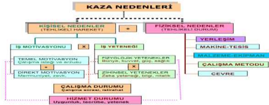
Şekil 2 İş Kazalarının Nedenleri

Çalışma hayatının en önemli sorunlarından birisi olan iş kazalarının birçok nedenleri bulunmaktadır. İş kazalarıyla ilgili yapılan araştırmalara göre; kazaların meydana gelmesinde çoğunlukla çalışanların birtakım kişisel özellikleri etkili olmaktadır. Bunun yanında makine, teçhizat ve çalışma ortamındaki hata ve eksiklikler iş kazalarının oluşmasına etki etmektedir (Camkurt, 2013: 70). İş kazalarının nedenleri Şekil 2'de gösterilmiştir.