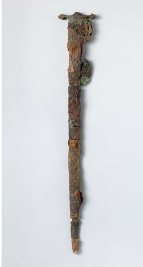
Figür III: Süvari kılıcı, IX-X. yüzyıl, İran, The Metropolitan Museum of Art, nr. 40.170.168.