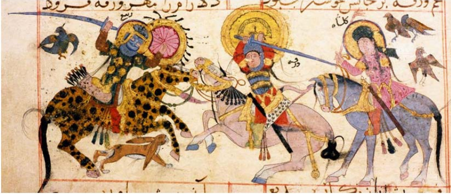
Figür II: Varka u Gulşâh eserindeki kılıç tasvirleri. (Yûsuf Meddâh, Varka u Gulşâh , TSMK , Hazine, nr. 841, 20a)

James W. Allan, Varka u Gulşâh 'ta bulunan kılıç tasvirlerinin karaçori olabileceğini düşünmektedir. Esasında bu eserde bulunan kılıç tasvirlerinin hem süvariler tarafından kullanılması hem de Fahr-i Mudebbîr'in karaçori tanımlamalarına uyması nedeniyle James W. Allan'ın fikri uygun görünmektedir (bk. Figür II) 40 .