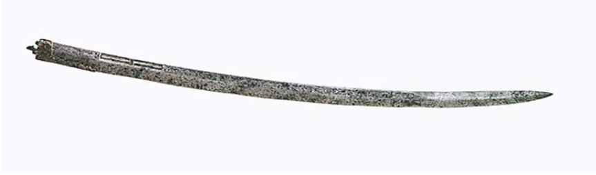
Figür I: Büyük Selçuklu kılıcı, XI-XII. yüzyıl, İran, The Furusiyya Art Foundation Collection, nr. R-249.

James W. Allan, Varka u Gulşâh 'ta bulunan kılıç tasvirlerinin karaçori olabileceğini düşünmektedir. Esasında bu eserde bulunan kılıç tasvirlerinin hem süvariler tarafından kullanılması hem de Fahr-i Mudebbîr'in karaçori tanımlamalarına uyması nedeniyle James W. Allan'ın fikri uygun görünmektedir (bk. Figür II) 40 .