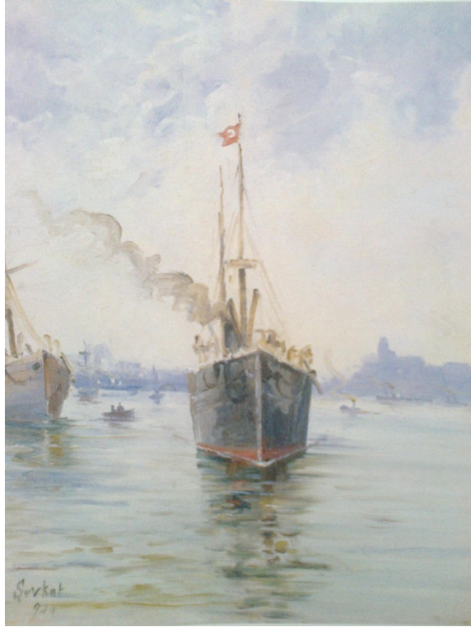
Fig.5 İstanbul Limanı, tuval üzerine yağlıboya, 1930, (Giray 1997:93).