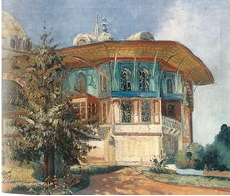
Fig.3 "Topkapı Sarayı Bağdat Köşkü", 1927, tuval üzerine yağlıboya, 50.5x60 cm (Özsezgin 1996:457).