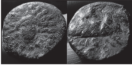
Fig. 1. Kral Arkhelaos (MÖ 36-MS 17) Dönemi'ne Ait Eusebeia Sikkesi (Sydenham 1933, no. 5)