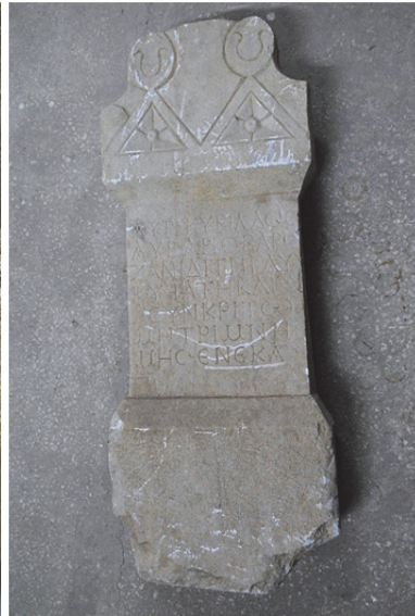
Fig. 18. Çift Alınlıklı Stel (Hacıbektaş Müzesi) (Kara 2015, 240)