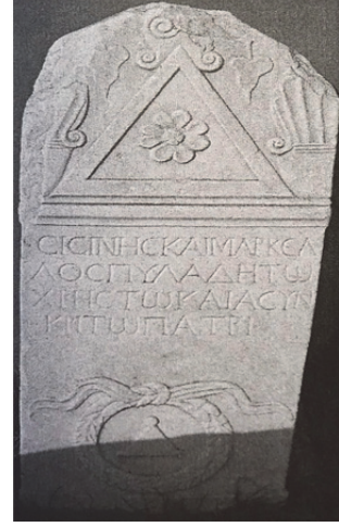
Fig. 11. Stel No. 6 (Kara 2015, 176)

Bazı stellerin alınlıklarındaki üçgenlerin köşelerinde kabartma şeklinde küçük yuvarlaklar yapılmıştır (Fig. 6-10). Benzer şekilde bir Hierapolis/Komana stelinde de (Fig. 11) yuvarlak ödül