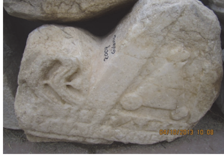
Fig. 9. Stel No. 4 (Kara 2015, 163)