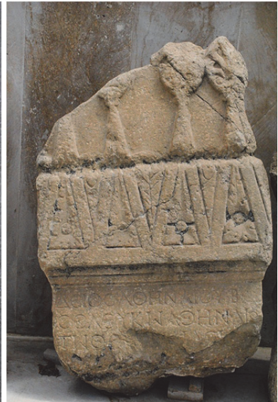
Fig. 19. 4 Alınlıklı Stel (Niğde Müzesi) (Kara 2015, 264)