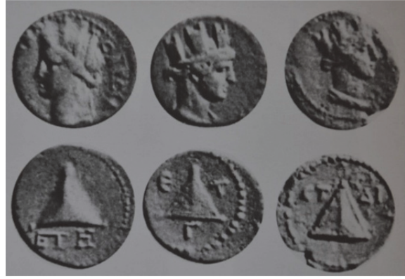
Fig. 16. Traianus Dönemi'ne (MS 98-117) Ait Üçgen Tasvirli Kaisarea Sikkeleri (SNG 1967, 6340-42)

çelengi içerisindeki üçgenin köşelerinde aynı yuvarlak şekiller yapılmıştır. Bu tip betimlemeler, bölgeye ait Traianus Dönemi sikkeleri üzerinde de görülmektedir (Fig. 15-16). Bu tarz üçgen betimlemelerin de Argaios'u simgelediği düşünülmektedir.