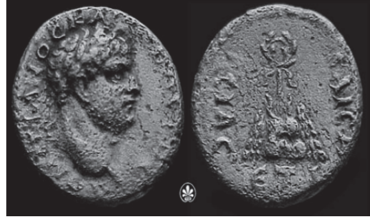
Fig. 20: İmparator Vespasianus (MS 77-78) Dönemi'ne Tarihlenen Kaisareia Sikkesi (RPC II, no. 1683)

Kappadokia Bölgesi, diğer bölgelere göre daha düz ve etrafı açık bir bölgedir. Bununla birlikte hakkında oldukça az araştırma yapılan bir bölgedir. Bu nedenle eski eser kaçakçılığının çok yapıldığı bölgelerden biridir. Kappadokia Bölgesi dışında bulunan müzeler ile yurt dışındaki müzelerde olan ve Anadolu'dan ele geçen steller ve diğer buluntular incelendiğinde, yukarıda anlatımı yapılan betimlemeler tespit edilmesi halinde söz konusu yerlerde bulunan steller ile diğer buluntuların Kappadokia Bölgesi'nden o yerlere bir biçimde götürüldüğü ve Kappadokia Bölgesi'ne ait malzeme olduğunu söyleyebiliriz.