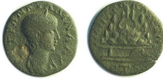
Fig. 5. İmparatoriçe Tranquillina Dönemi'ne (MS 243) Tarihlenen Kaisareia Sikkesi (Sydenham 1933, no. 617a)

Diğer benzer örnekleri kronolojik olarak sırasıyla sayarsak: Roma imparatorları Vespasianus, Titus, Traianus, Hadrianus, Antoninus Pius, Marcus Aurelius, Lucius Verus, Commodus, Septimius Severus, Caracalla, Diadumenianus, Elagabalus, Severus Alexander, III. Gordianus dönemlerine ait sikkelerde de benzer Argaios betimlemeleri bulunmaktadır. Bu sikkelere en son örnek imparator III. Gordianus'un karısı Sabinia Tranquillina'ya ait (MS 243) bir Kaisareia sikkesidir. Bu sikkenin ön yüzünde imparatoriçe Tranquillina'nın portresi, arka yüzde bir altar üzerinde Argaios Dağı betimlenmiştir (Fig. 5). Benzer bir biçimde Kappadokia'daki Hierapolis kentinin imparator Nero Dönemi'ne ait sikkelerinin arka yüzünde de dağ betimlemeleri yer almıştır 17 . Bilindiği üzere Hierapolis kent devleti antikçağda Anadolu'nun en önemli tapınak devletlerinden birisi sayılan Kappadokia Komana'sının üzerinde yükselmekteydi. Tapınak devleti Komana, Kappadokia kralı Arkhelaos'un hükümdarlığında (MÖ 36-MS 17) polis devletine dönüştürülmüştü 18 . Söz konusu sikkelerin arka yüzlerinde karşılıklı bir biçimde duran iki büyük dağ betimlenmiştir. Hierapolis'deki veya olası başka yerlerdeki dağ motiflerinin Argaios olduğunu elbette ki söyleyemeyiz. Ancak Kappado-