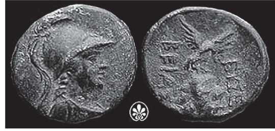
Fig. 2. Kral Arkhelaos (MÖ 36-MS 17) Dönemi'ne Ait Eusebeia Sikkesi (Sydenham 1933, no. 14)