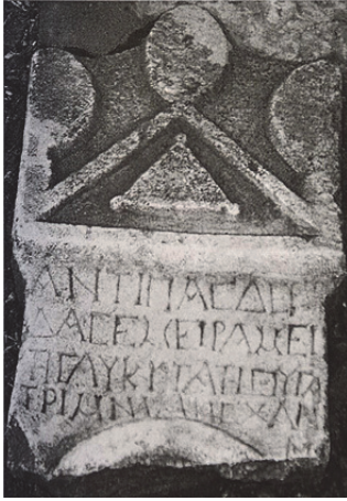
Fig. 7. Stel No. 2 (Kara 2015, 98)