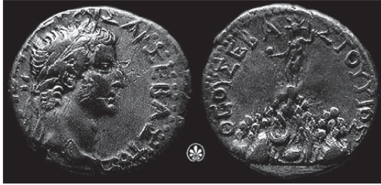
Fig. 3. İmparator Tiberius (MS 14-37) Dönemi'ne Tarihlenen Kaisareia Sikkesi (Sydenham 1933, no. 42)