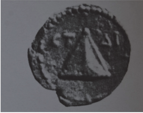
Fig. 15. Üzerinde Üçgen Tasvir Bulunan Bir Kaisarea Sikkesi (Weiss 1985, 38 taf. 14, kat. no. 65)