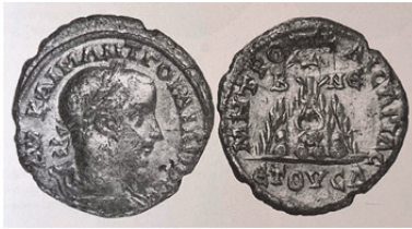
Fig. 12. Gordianus III Dönemi'ne Ait (MS 238-244) Kaisarea Sikkesi (Durukan 2012, 233 res. 98)