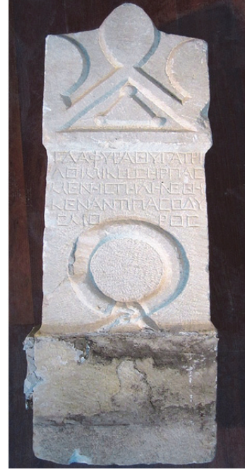
Fig. 6. Stel No. 1 (Kara 2015, 96)

Stel, 8242 envanter numarası ile Malatya Müzesi'nde sergilenmektedir. 1988 yılında Kahramanmaraş'tan satın alma yolu ile elde edilmiştir. Yüksekliği 76 cm, genişliği 23 cm, kalınlığı 14 cm'dir. Mermerden yapılmıştır. Stel sağlam durumdadır. Üçgen alınlıklıdır. Stelin tepe akroteri ovoid, köşe akroterleri yarım ovoid şeklindedir. Akroterler işlenmemiştir. Alınlık içerisinde kabartma şeklinde yapılmış bir üçgen motifi bulunmaktadır. Bu üçgenin köşelerinde yine kabartma şeklinde yuvarlak şekiller vardır. Gövdede 5 satırdan oluşan Hellence yazıt vardır. Gövdede yazıtın alt kısmında yuvarlak ödül çelengi yapılmıştır.