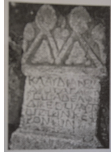
Fig. 10. Stel No. 5 (Kara 2015, 246)

miş bir motiftir. Gövdede 5 satırdan oluşan eski Hellençe yazıt vardır. Gövdede yazıtın alt kısmında yuvarlak ödül çelengi yapılmıştır. Ödül çelengindeki detaylar çizgisel olarak işlenmiştir.