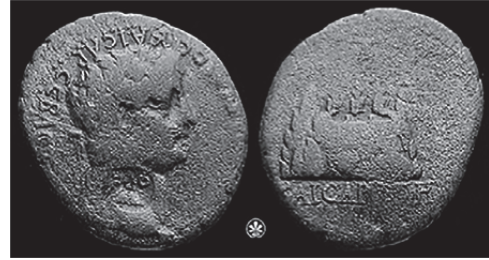
Fig. 4. İmparator Claudius (MS 47-48) Dönemi'ne Tarihlenen Kaisareia Sikkesi (Sydenham 1933, no. 60)