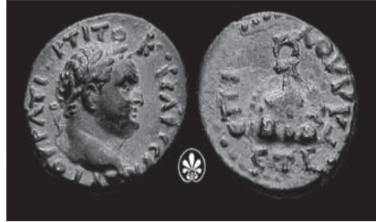
Fig. 21: İmparator Titus (MS 80-81) Dönemi'ne Ait Kaisareia Sikkesi (Sydenham 1933, no. 119)