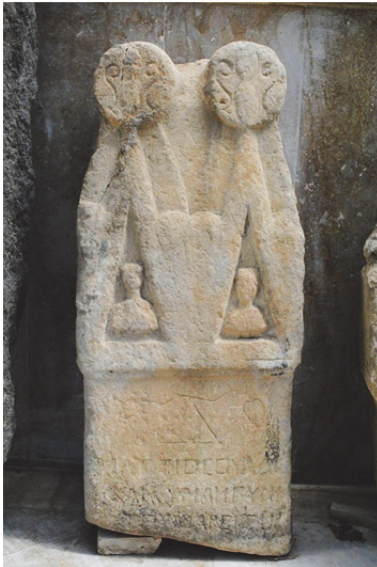
Fig. 17. Çift Alınlıklı Stel (Niğde Müzesi) (Kara 2015, 238)

Argaios Dağı, Kappadokia Bölgesi'nin en yüksek dağıdır. Aynı zamanda antikçağda da aktif olan volkanik bir dağdır. Bu nedenle antikçağ boyunca bölgede yaşayan insanların kutsal olarak kabul ettiği bir dağdır. Bir kez daha hatırlatmak gerekirse, Argaios Dağı, Hellen mitolojisinde "Argaios-Oros" olarak isimlendirilmektedir. Mısırlıların, Apollon'u Isis'in oğlu saymaları ve ayrıca Horus'un da Isis'in oğlu olması Argaios-Oros ile Apollon'un ilişkisi olabileceğini akla getirmektedir 27 . Buradan da Argaios'un başlı başına kutsal bir tanrı olarak kabul gördüğü anlaşılmaktadır. Kappadokia'nın baş tanrısı olarak kabul edilen Argaios-Oros, antikçağ ikonografisinde çok çeşitlilikte yapı-