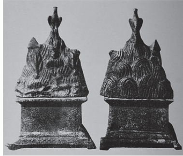
Fig. 13. Argaios Dağı'nı Tasvir Eden Agalmalar (Baydur 1994, kat. no. 1-2)