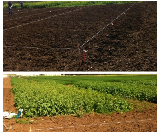
Şekil 2. Deneme alanının hazırlanması ve parsellerde yetiştirilen bitkiler