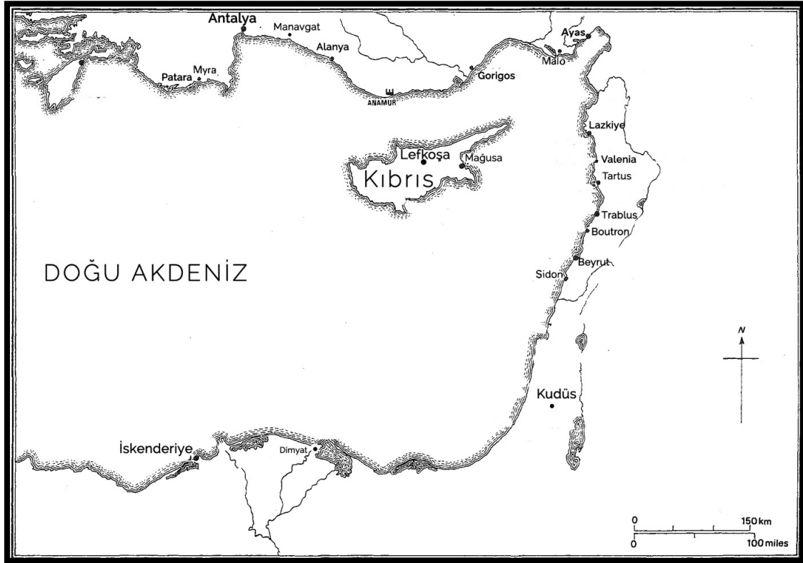
Fig. 2. 1360'tan İtibaren Lusignanların Saldırı Noktaları

di. Çivi ve demir gibi yanmayan malzemeleri de denize döktüler. Buradan Lazkiye'ye yönelik filo kötü hava koşulları ve limanın güçlü tahkimatı dolayısıyla karaya çıkmayı başaramadı 42 .