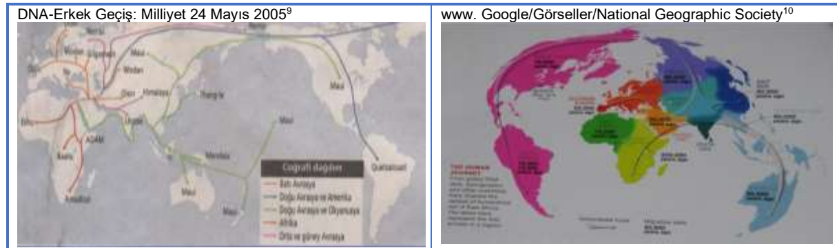
Şekil 1: DNA analizi ile Homo sapiens, sapiens dağılımı

Kadınlar ile farklı genetik dağılım olduğu sanılabilir. Evlilikte seçici olan kadındır ve kültürel sahip olmanın da en fazla kadın ile sağlandığı bilinmektedir. İster zorla olsun ister bireylerin tercihi şeklinde olsun, evliliklerin tek ırk ve tek genetik yapı içinde oluşacağı var sayılabilir. Ancak, melez yapının oldukça sık olması ile, genetik yapının tüm Dünyada bir etken değil, insanların bir geniş karma yapı içinde olduğu görülmektedir. Tüm Amerika yerlilerinin aynı genetik yapıda olması gibi bölgesel kümeleşmenin olması da doğaldır. Birçok ülke, kendini özel ve özgün bir genetik yapısı olarak gen analizleri yapılmış, ancak tam bir karmaşa yapıda olmaları ile ulus yapısını genetik kaynağa dayandırılmamıştır. Ermeniler ve Kürt denilen grupların saf olmadıkları, karma genetik yapıları olduğu gözlenmiştir. Aynı şekilde de Eskişehir yakınında olan Gordion tarih öncesi oluşumların genetik yapısı, Avrupa, İngiltere’de görüldüğü sözel, bir uluslararası genetik toplantıda öğrenilmiştir.